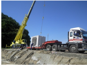
いよいよ据付です。ちなみにBOXカルバートは内陸の工場で作製して運搬してきました。