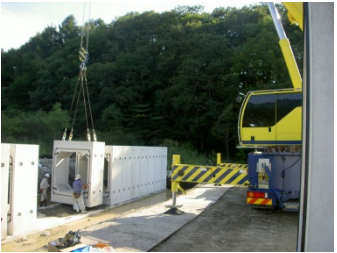
きれいに隙間なく並べて、接合させていきます。今回は65tクレーンを使用しました。