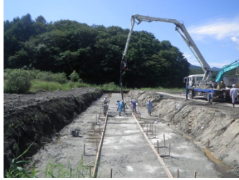
BOXカルバートを据付する箇所にコンクリートを打設します。