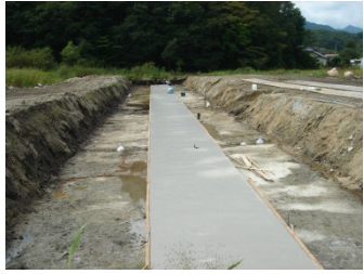
コンクリートが固まるまで養生します。