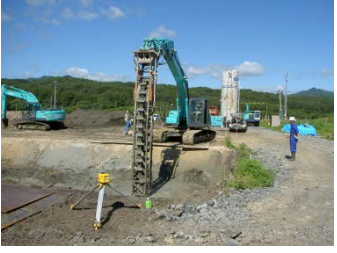
BOXカルバートを設置するために地盤改良を実施しました。