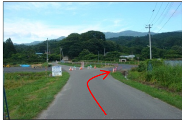
田名部地区でBOXカルバートを施工します。迂回路の利用の際は、走行に十分注意をお願いいたします。 ◆施工:①板宮建設