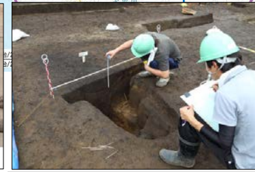
落とし穴が確認されています。形状から縄文時代のものと考えられます。(埋蔵文化財センターHPより) ◆調査:埋蔵文化財センター