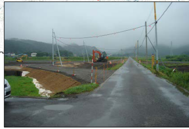
豊間根小学校の近くでBOXカルバートを施工します。9月中旬に迂回路が完成予定です。9月中旬に迂回路が完成予定です。走行に注意をお願いいたします。 ◆施工:②中間組