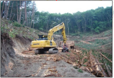
弘川地区で伐採作業を実施しています。今後は豊間根地区でも伐採を実施予定です。 ◆施工:⑥宮古地方森林組合