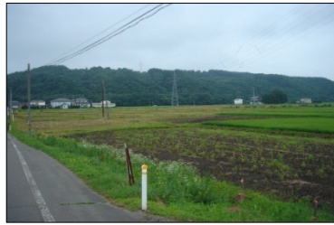
荒川地区で道路改良とBOXカルバートを設置する工事が契約になりました。よろしくお願いいたします。 ◆施工:⑤矢作建設工業