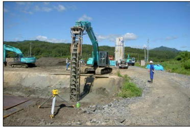
BOXカルバートを設置するための地盤改良を実施しています。BOXカルバートは3基施工します。 ◆施工:①板宮建設