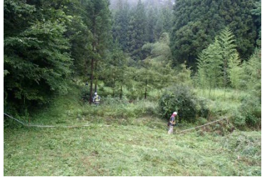
馬越地区で道路改良を実施予定です。伐採前の下草刈作業を進めています。 ◆施工:④樋下建設