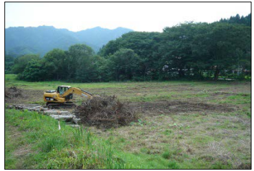
荷竹地区でBOXカルバートを施工予定です。伐採作業を進めています。 ◆施工:③日本国土開発