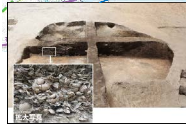
縄文時代の竪穴住居跡です。貝を介して当時の食生活をうかがうことができる発見です。 ◆調査:埋蔵文化財センター