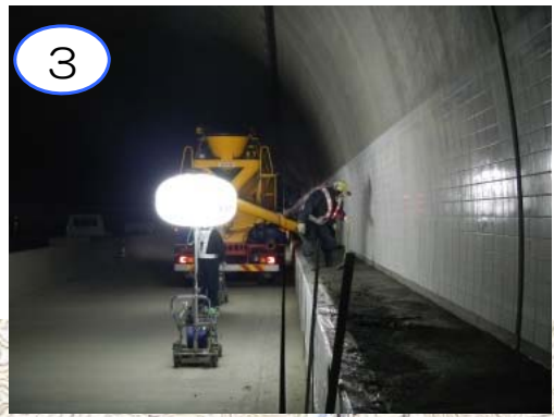
3 摂待第2トンネル内において、点検用の通路下の埋土、コンクリートシートを施工しています。