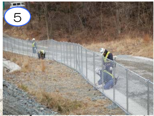
5 小本地区において、立入防止柵の設置を行っています。