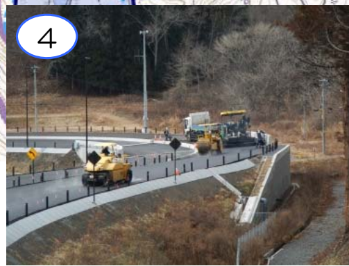
4 岩泉南ICのランプにおいて、舗装(表層)の施工を行っています。