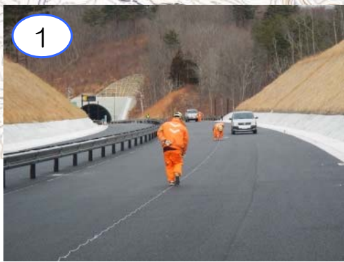
1 向新田地区では、舗装や防護柵の施工が概ね完了しました。現在、路面標示の準備を行っています。