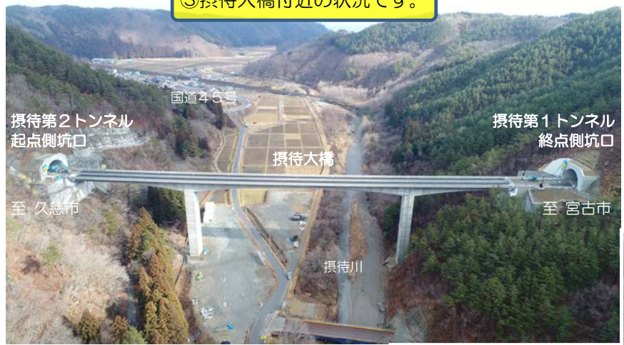
③摂待大橋付近の状況です。