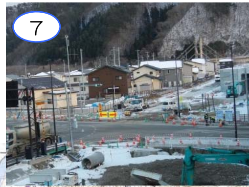
7 岩泉龍泉洞ICにおいて、新たに接続される宮古方面へのランプ施工に伴う国道455号の改良工事を行っています。