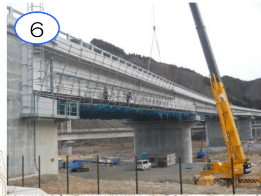
6 新小本大橋は、車両が通る床の部分の工事が完了し、足場の解体を行っています。