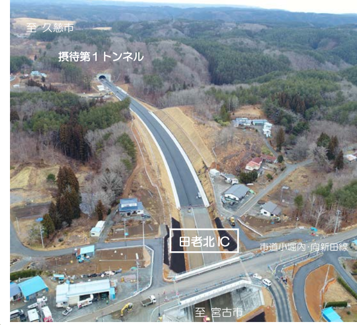
②摂待第1トンネルから田老北 IC 方面をみた状況です。