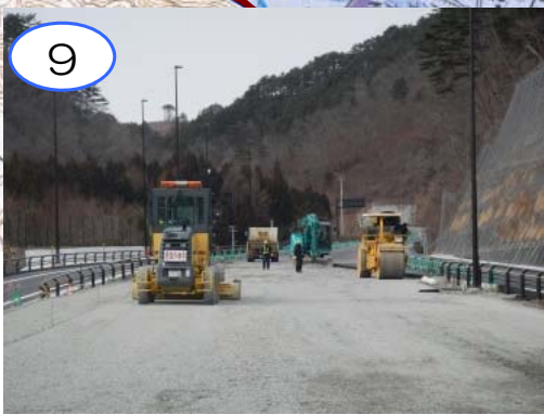
9 岩泉龍泉洞ICの北側において、本線の路盤を施工しています。