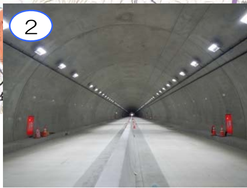
2 摂待第1トンネルは電気が通り、概ね完成しました。