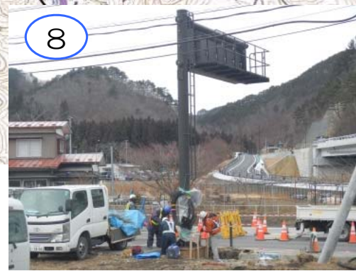
8 国道455号の拡幅に伴い、既設道路情報板の移設を行っています。