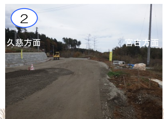
(主)岩泉平井賀普代線の付け替え工事を進めています。