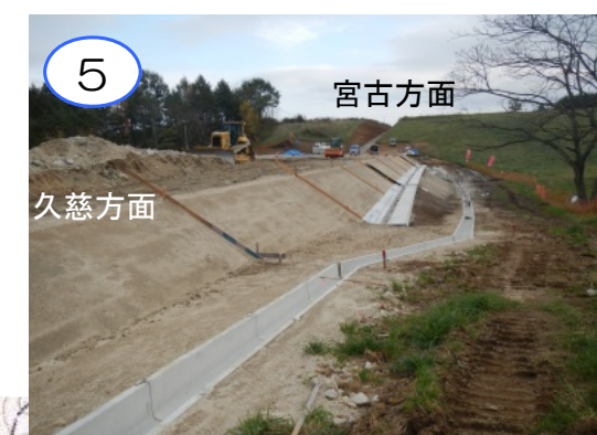
島越地区の盛土区間です。尾肝要普代道路の工事にて盛り土工事を行なっています。