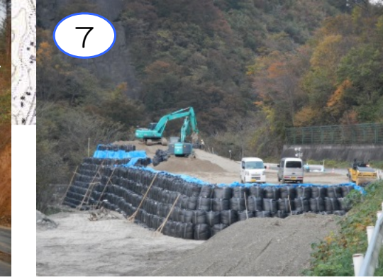
現在、新思惟大橋では工事用進入路の工事が進められています。今後、仮設構台や橋梁下部工工事を施工していく予定です。