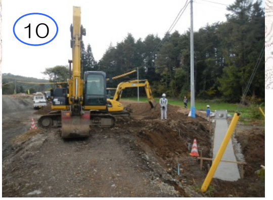
アクセス道路施工箇所の切り土、盛り土や排水構造物の施工を行っています。