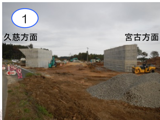
大芦こ道橋の橋台(躯体)の施工は完了しました。引き続き、橋台の埋戻しを行っています。