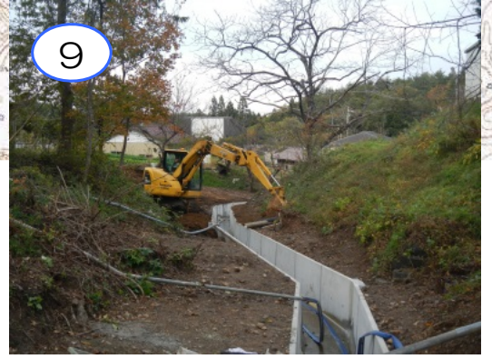
流末水路(プレキャストU型側溝、現場打水路等)の施工を行っています。