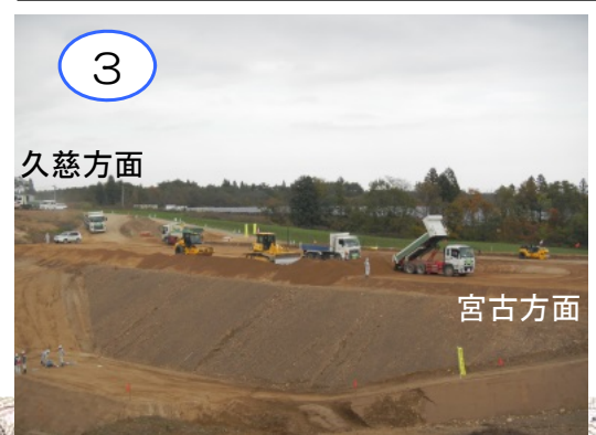
田野畑ICの本線及びランプの切り土工事が開始されました。掘削した土は、田野畑南ICへ運搬し、本線の盛り土として利用します。