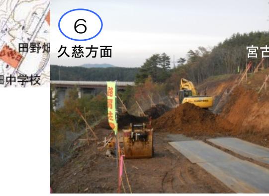
現在、新思惟大橋では工事用進入路の工事が進められています。今後、仮設構台や橋梁下部工工事を施工していく予定です。