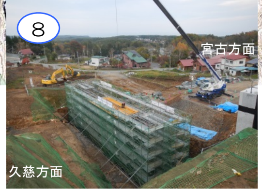
田野畑村管理の配水場までの道路を付け替えています。