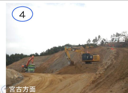
現在、新思惟大橋では工事用進入路の工事が進められています。今後、仮設構台や橋梁下部工工事を施工していく予定です。