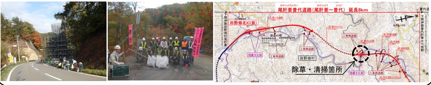
尾肝要普代道路 工事箇所一覧

また、尾肝要普代道路の芦渡南工区においても、10月28日（土）に約20名で、工事出入口周辺の 国道45号沿い約300m区間について、草刈り及び清掃を行いました。