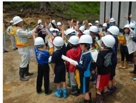
質問タイム。聞きたいことがたくさんあります。