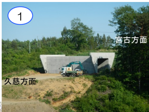
本線を横断するトンネル（ボックスカルバート）が完成しました。