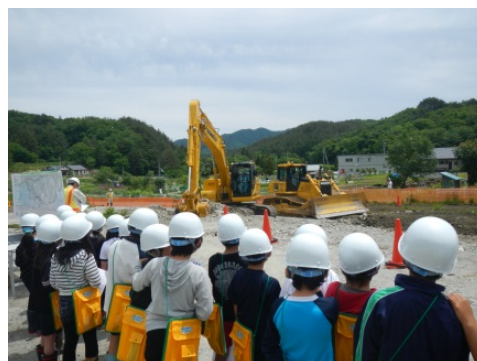
大型建設機械の実演を見学。すごい迫力！！