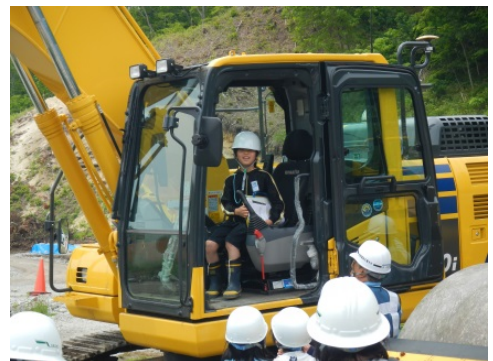
大型建設機械に順番に乗せてもらいました。

また、完成しているボックスカルバートにクレヨンで落書きをしたりと、普段はできない体験に、歓声を上げていました。