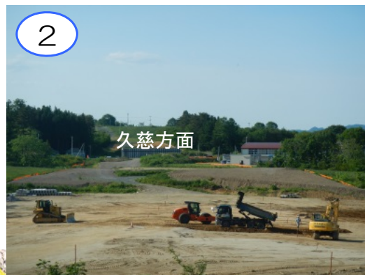
本線部に土を運び入れ、盛土の工事が進めています。