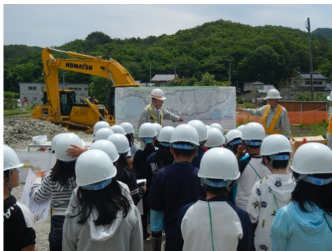
三陸沿岸道路事業の内容や工事の概要の説明を真剣に聞いています。

三陸沿岸道路事業の内容や工事の概要について説明を受けた後、ブルドーザや振動ローラなどの大型建設機械の実演では、敷均し・転圧の迫力のある作業を間近に見学。大型建設機械見学では、代わる代わる試乗体験を行いました。