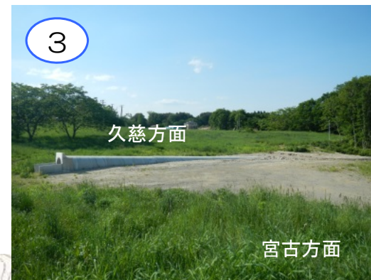
ナカヒラ沢と隣の沢が三沿道の本線の下へ埋まるので沢の水を通す横断管を設置する工事（2箇所）が完了しています。今後の工事で横断管の上を盛土して本線を構築する工事を行う予定です。