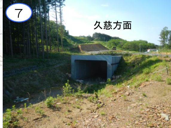
(仮称) 田野畑IC本線部の一部の土工工事やインター周辺における流末水路、国道45号アクセス道路の施工を行います。