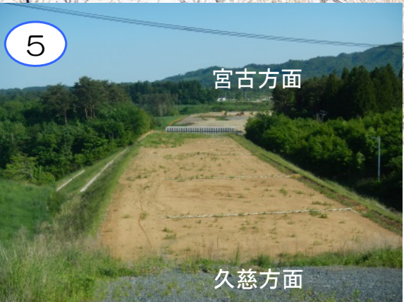
島越地区の盛土区間です。盛土は完成形に仕上がっています。仕上げの工事（舗装工事）が残っています。