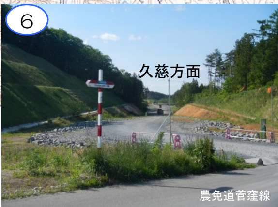
菅窪地区の農免道菅窪線交差付近の区間です。本線を交差するための構造物や三陸道本線の工事を今後整備します。