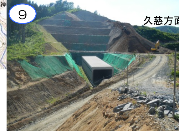
(仮称) 田野畑ICから久慈方面に向かって本線へ合流する道路付近です。本線部や宮古方面への出口道路の工事を今後整備します。