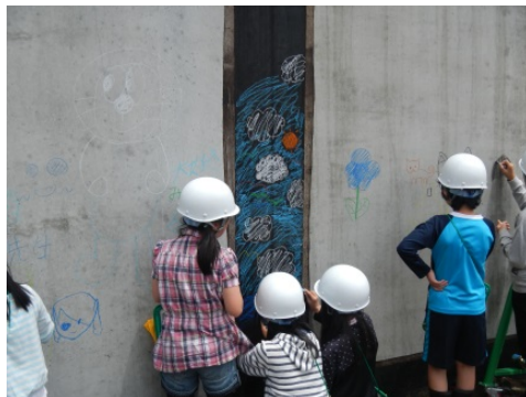
完成した構造物に時間が経つのを忘れて思い思いに落書きをしました。

最後に「働いて良かったこと」、「仕事の分担や役割があるのか」など、事前の学習で児童が疑問に思ったことに工事担当者が回答して、活気あふれる体験学習は終了しました。