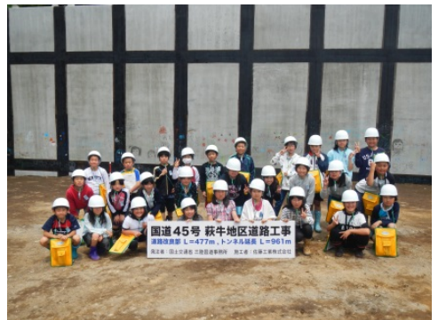
クレヨンで落書きしたボックスの前で記念撮影です。