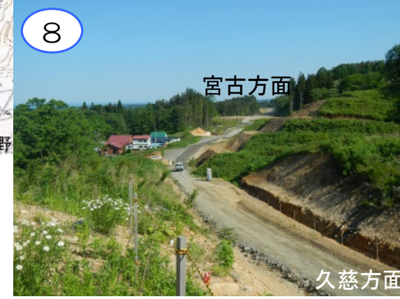
(仮称) 田野畑ICの中央部付近です。本線部や久慈方面への出口道路の工事を今後整備します。