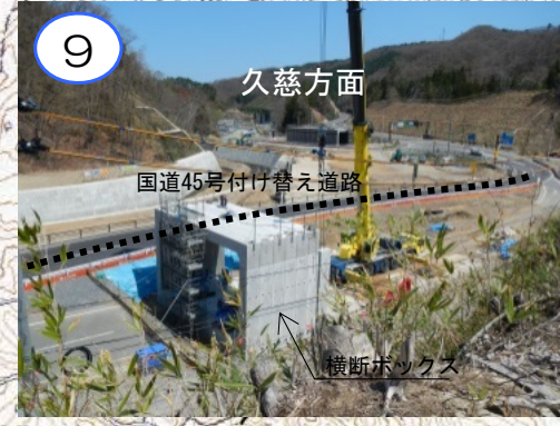
国道45号を付け替えて、将来、三陸沿岸道路をくぐるためのトンネル(横断ボックス)を作っています。