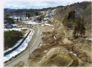
UAV による空撮 (土工箇所)