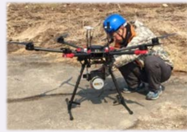
レーザースキャナ搭載型 UAV