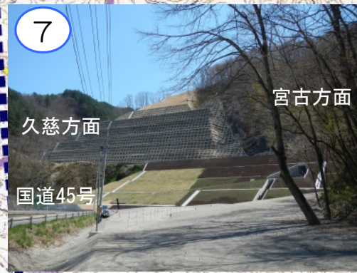
国道45号に面した盛土部の工事が完成しました。