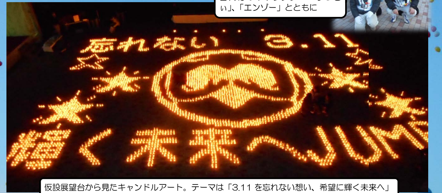
仮設展望台から見たキャンドルアート。テーマは「3.11を忘れない想い、希望に輝く未来へ」