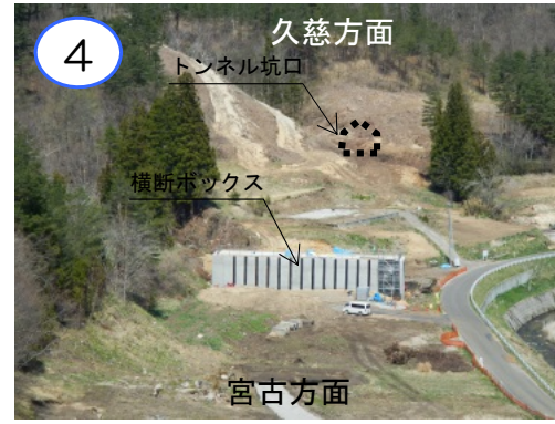
(仮称)萩牛トンネルの掘削に先立ち、トンネル手前の盛土を横断する横断ボックスを作っています。