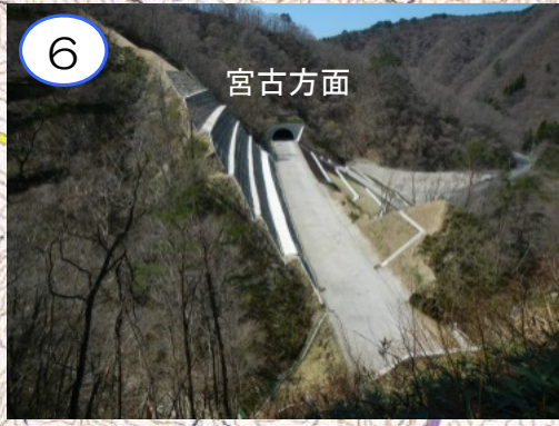
(仮称)柏木平第2トンネル宮古側坑口から見た工事完成状況です。