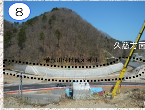
普代川付け替え河川の右岸側の護岸工事を進めています。