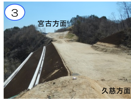
③ 国道45号 萩牛地区道路工事 施工:佐藤工業(株)