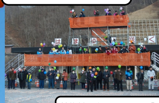
普代村のキャラクター「すっきい」、「エンゾー」とともに