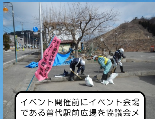
イベント開催前にイベント会場である普代駅前広場を協議会メンバーで清掃しました。

普代中学校生徒デザインのキャンドルアートを上から眺めるための仮設展望台を設置しました。