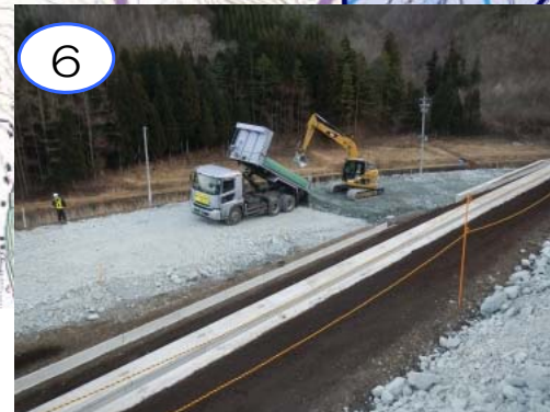
岩泉南ICにおいて舗装の土台となる路床の工事を進めています。