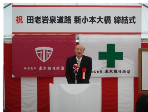
祝辞(伊達岩泉町長)

平成29年度開通予定の三陸沿岸道路「田老岩泉道路」(延長約6km)のうち、小本川及び三陸鉄道北リアス線を跨ぐ新小本大橋(L=362m)の上部工がつながることを記念して、締結式が行なわれました。締結式では岩泉町長をはじめ、来賓者による橋桁の最終ボルトの締め付けが行なわれ、岩泉町のキャラクター「龍泉洞の龍ちゃん・泉ちゃん」とともに、橋が一本につながったことを祝いました。