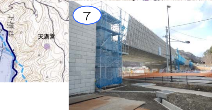
小本高架橋は、全ての橋桁が架かりました。引き続き、車両が通る床の部分の工事を進めています。