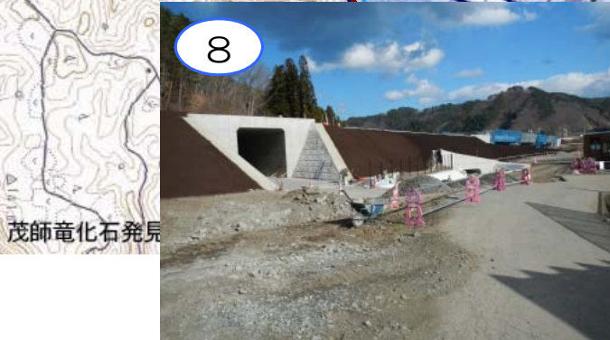
国道45号から本線(久慈方面)へ合流するための道路の土工が完成しました。