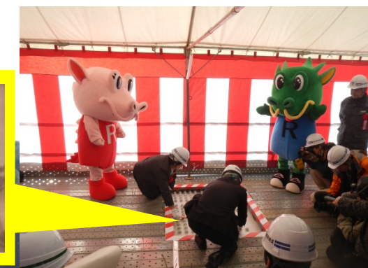
主桁最終ボルトの締結