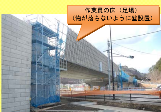
作業員の床（足場） （物が落ちないように壁設置）