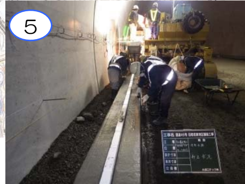
摂待第1トンネル内において、トンネル内に引き込んだ雨水、清掃用の水などを流す水路の施工を行なっています。