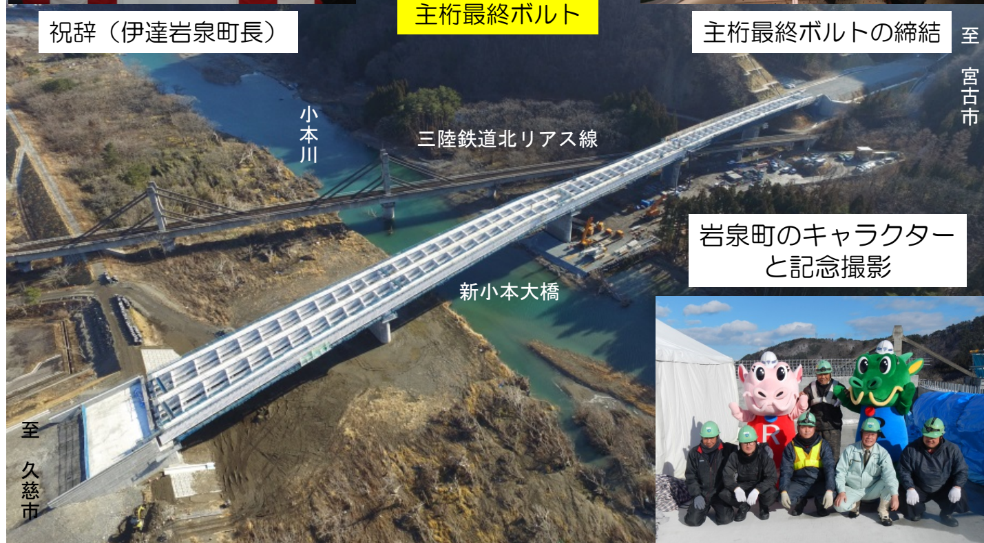
岩泉町のキャラクターと記念撮影