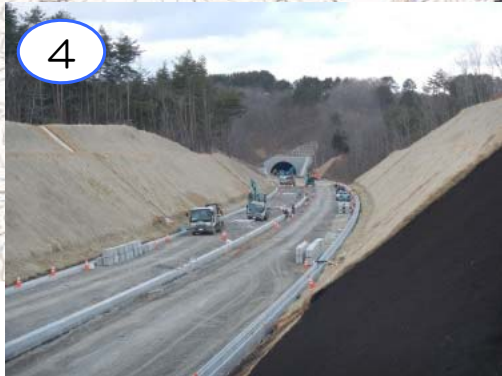
向新田地区の舗装工事を進めています。道路上の雨水を流す水路の設置を行なっています。