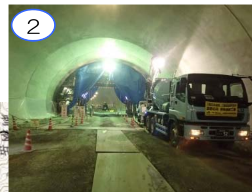
摂待第2トンネルでは、トンネルの掘削面をコンクリートで覆う覆工の工事を進めています。トンネル延長1,772mのうち約1,400m完成しています。