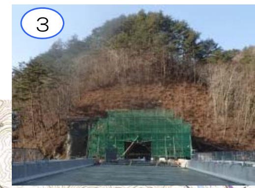
摂待第2トンネルの終点側坑口において、トンネルの周りの土を抑える壁を作っています。