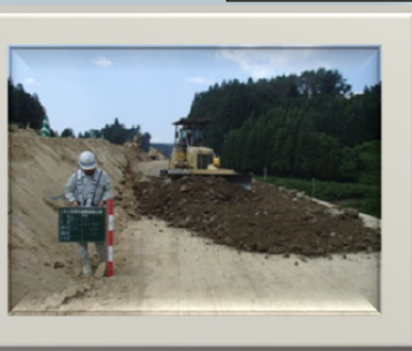
(他所での実施事例です)

4月からお世話になります。工事箇所近隣には住宅等も有りますので、地域の方々のご協力を得て工事を進めていきたいと思ひます。よろしくお願いいたします。