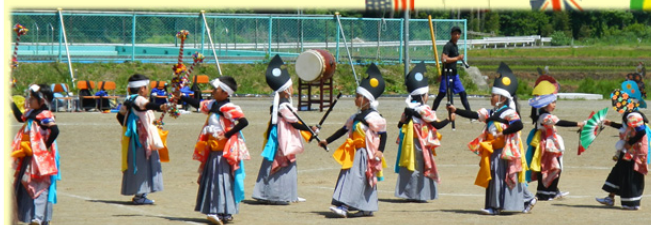
全校児童(16名)で一斉懸命練習した成果発表です