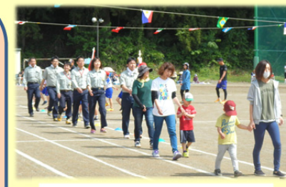
新しい万国旗の下で「入場行進」

競技種目では、「撰待七ツ物」(郷土芸能)などに親しんだ他、JV社員も地元の皆さんと一緒に競技に参加し、皆さんからの大きな声援を受け、五月晴れの1日を楽しく過ごしました。