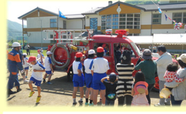
「消防団の操法披露」後の試乗体験も

校長先生からは、「地域の人材を育てるためにも企業の皆さんと一緒に楽しむ意義深い事柄」とのお話を頂いた他、PTA会長さんからは、学校行事への積極的な参加等に対する感謝状を頂きました。会場の皆さんからも大きな拍手を頂き、大盛況のうちに運動会は終了し、会場の跡片付けにも地域の皆さんと一緒にを行いました。