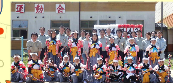
「撰待七ツ物」装束の児童とJV社員の集合写真です