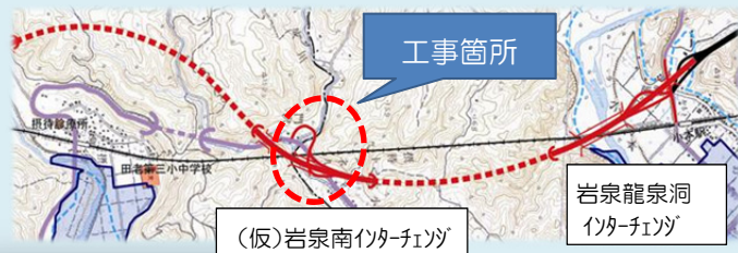
(仮)岩泉南インターチェンジ

国道45号に近接した工事現場で、盛土作業と並行して擁壁工(プレキャストL型擁壁、補強土壁)を施工しますので、安全第一に努め“ゼロ災職場”を目指し工事完成に尽くします。