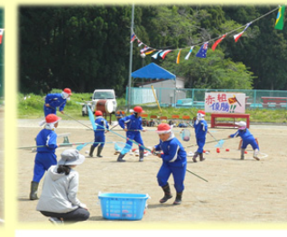
田老名物「カゼとり名人」競技