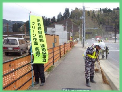
国道 455 号(岩泉町:岩泉龍泉洞 IC 付近)