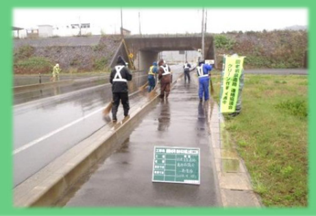
町道(岩泉町:三陸鉄道交差路付近)

【最近の活動事例③】 「橋梁下部工のライトアップを行っています」 ・岩泉龍泉洞IC付近は、集団移転が進み「こども園」の開園や「小・中学校」の開校など新しい町が出来つつ有り、工事現場周辺の歩道は「通学路」となっています。 ・国道455号を跨ぐ(仮称)小本高架橋の下部工(橋脚・橋台)を担当する岩泉地区道路工事では、4月下旬から照明灯具で明るく照らす取り組みを行っています。