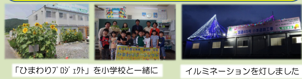
「ひまわりプロジェクト」を小学校と一緒に