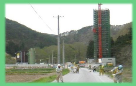
市道(宮古市:上摂待地区付近)

【最近の活動事例③】 「橋梁下部工のライトアップを行っています」 ・岩泉龍泉洞IC付近は、集団移転が進み「こども園」の開園や「小・中学校」の開校など新しい町が出来つつ有り、工事現場周辺の歩道は「通学路」となっています。 ・国道455号を跨ぐ(仮称)小本高架橋の下部工(橋脚・橋台)を担当する岩泉地区道路工事では、4月下旬から照明灯具で明るく照らす取り組みを行っています。