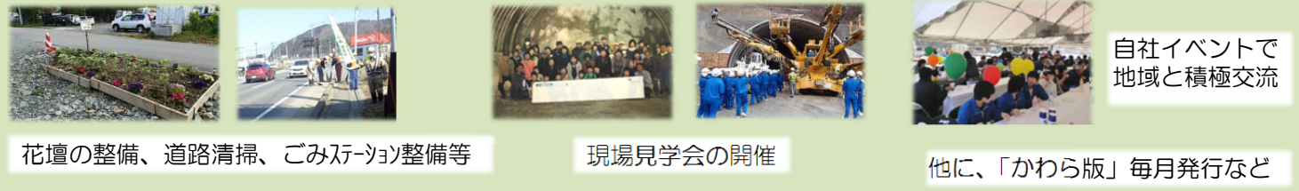
花壇の整備、道路清掃、ごみステーション整備等