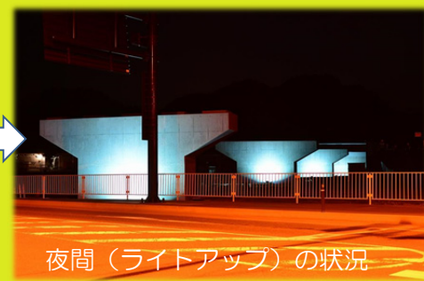
夜間(ライトアップ)の状況