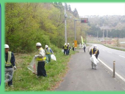
国道 45 号(宮古市:摂待地区付近)

【最近の活動事例②】 「国道等の道路清掃に取り組みました」 ・三陸沿岸道路工事で日頃使用している道路が、工事車両増加に伴い汚れが目立ち美観を損ねています。 ・安全協議会メンバーでは、多くの観光客が訪れるGW前に、道路清掃活動に取り組みました（85名）。今後も随時、清掃活動を行って参ります。