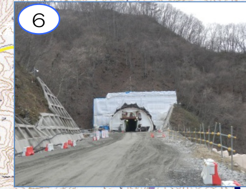
6 (仮称)柏木平第1トンネル久慈側坑口の坑門工を工事中です。