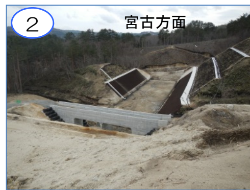
2 宮古方面 田野畑村沼袋地区の工事進捗状況です。