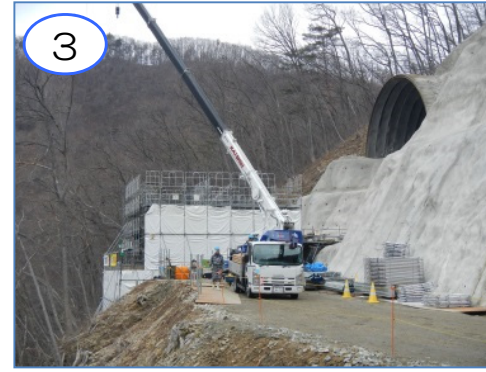
3 普代川右岸部の(仮称)新柳瀨橋のA2橋台を工事中です。