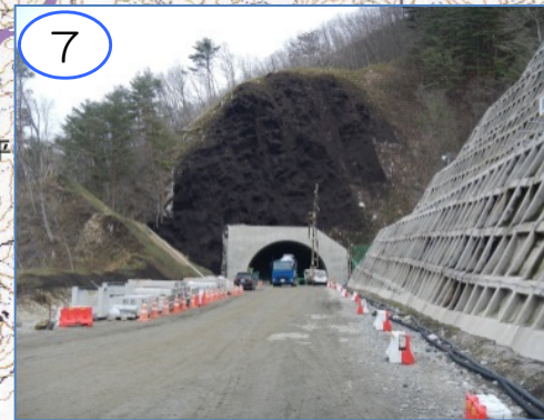
7 (仮称)柏木平第2トンネル宮古側坑口上部には落石対策を施しています。