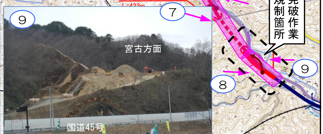
9 国道45号沿いの急斜面の山の切り取り工事を進めています。4月中旬から発破作業による国道の一時通行止め(5分間程度)にご協力願います。