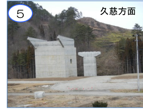
5 久慈方面 普代川を渡る(仮称)芦渡橋のA1橋台とP1橋脚は完成しました。