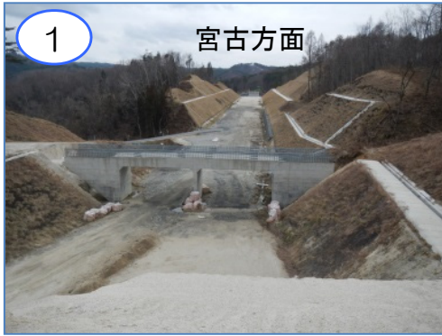
1 宮古方面 田野畑村滝ノ沢地区の工事進捗状況です。