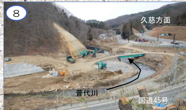
8 普代川の付け替え工事として、左岸側仮締め切りを行い、護岸ブロック積み及び山部分の切り取り・掘削工事中です。