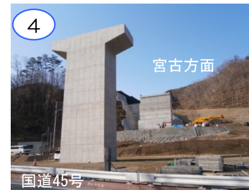
4 宮古方面 (仮称)新柳瀨橋のP1橋脚とA1橋台は完成しました。