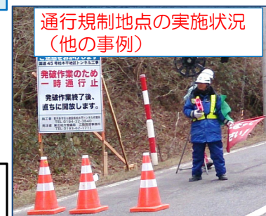
通行規制地点の実施状況(他の事例)