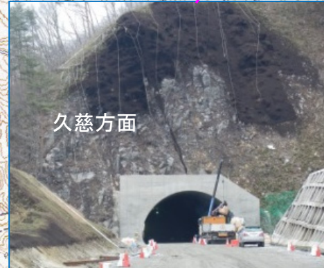
(仮称)柏木平第2トンネル宮古側坑口 部上部の落石対策工を工事中です。