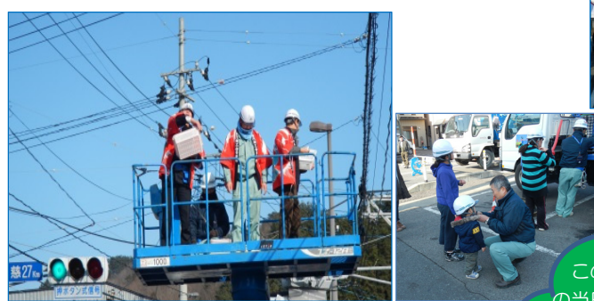
交通信号機の上の高さから、“ヘルメット”と“安全带(命綱)”の万全な装備で景気良く“餅まき”や、子ども達も高所からの眺めを試乗体験で楽しんでいました。