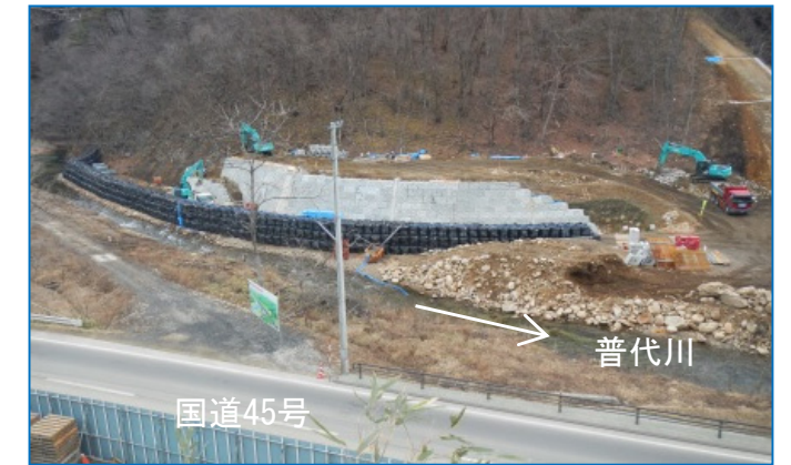
普代川の左岸側仮締め切り(大型土のう積み)を行 い、護岸ブロック積み等の付替え工事中です。