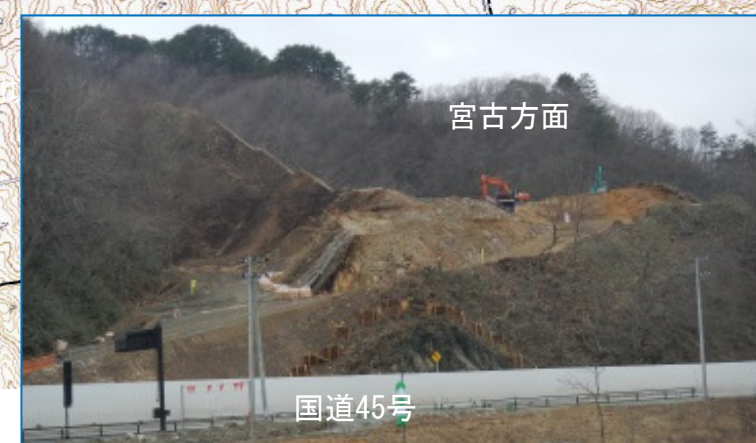
③ 普代南地区 改良工事 施工:青木あす なろ建設(株)