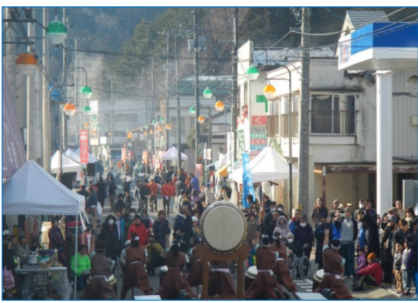
“ふだいまるごと元気市”で賑やかにオープニング。