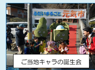
ご当地キャラの誕生会

1月17日（日）の冬晴れの天候のもと、普代村で商店街活性化と復興を目指した「ふだいまるごと元気市」が開催されました。この催しでは、三陸沿岸道路の建設に係る田野畑・尾肝要普代道路工事安全協議会等のメンバーが初めて参加し、道路工事の進み具合の紹介や工事車両等の展示・試乗会やクイズ等の出展を行い、子供さんや地域の皆さんと交流を深める事が出来ました。元気市恒例の“北緯40度餅まき”では、今回は趣向を変えて高所作業車からの餅まきも加わり、普代村長さん・商工会長さんと一緒に工事安全協議会会長は、初めての“餅まき”体験をさせて頂き感謝いたしました。有難うございました。