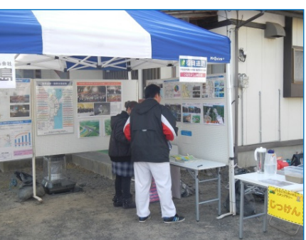
三陸沿岸道路の工事進捗状況等をパネル展示で紹介しました。測量体験やラジコン操縦等にも楽しんで頂きました。

特別企画 ～ 工事事業者コーナー～ ○ 高所作業車試乗 ○ ダンプと綱引き ○ 重機ラジコン操縦体験 ○ 展示コーナー ○ その他 今回の取り組みメニューです