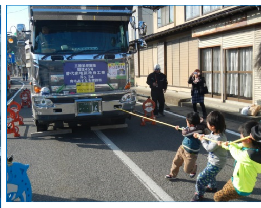
子ども達と“ダンプカーと綱引き”勝負！力を合せるとダンプが動き出しました。

特別企画 ～ 工事事業者コーナー～ ○ 高所作業車試乗 ○ ダンプと綱引き ○ 重機ラジコン操縦体験 ○ 展示コーナー ○ その他 今回の取り組みメニューです