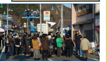
商店街の2階から恒例の“餅まき”に大賑わい。

このイベントの様子は、IBC岩手放送の当日夕方に放送の「IBCニュースエコー」の中でも「普代村で「まるごと元気市」として、活気ある風景が放映されています。