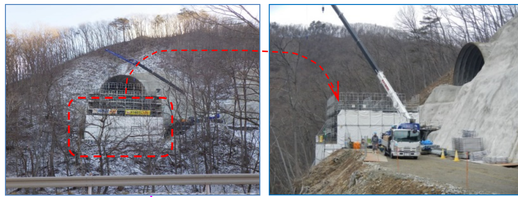
普代川右岸部の(仮称)新柳瀨橋のA2橋台を工事中です。