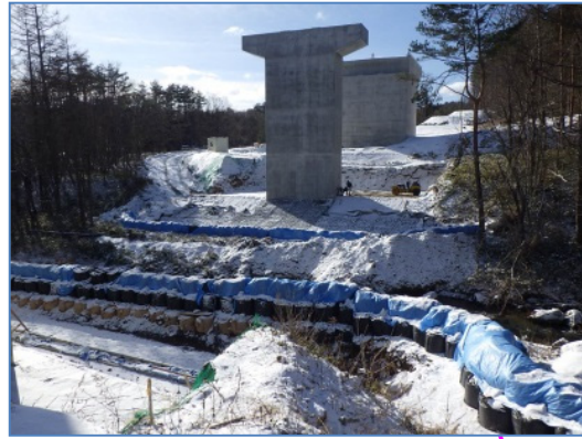
(仮称)新一の渡橋の橋脚工事に 関連する河川護岸を工事中です。