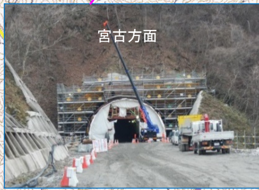
(仮称)柏木平第1トンネル久慈側 坑口部の坑門工を工事中です。