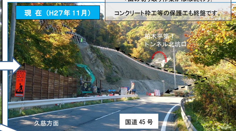
柏木平第1 トンネル北坑口