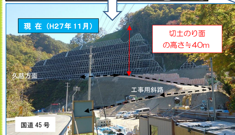
切土のり面 の高さ≒40m