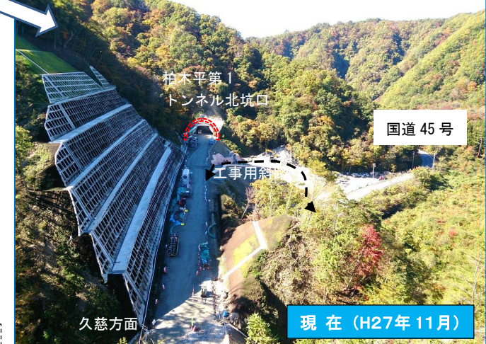
柏木平第1 トンネル北坑口