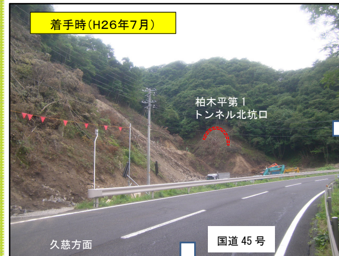
柏木平第1 トンネル北坑口