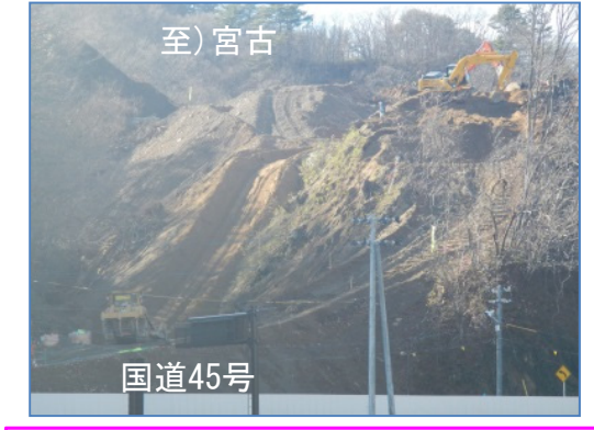
③普代南地区改良工事 施工:青木あすなる建設(株)