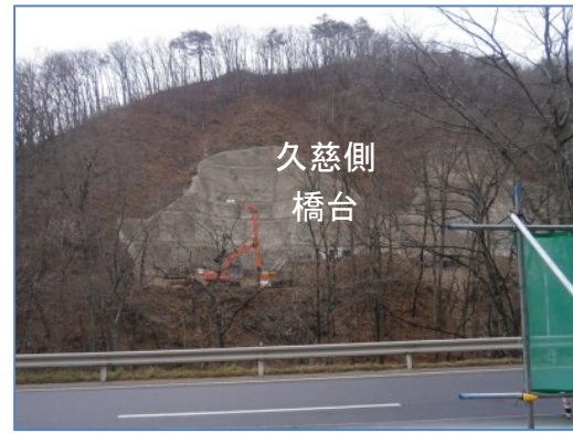
②新柳瀨橋下部工工事 施工:(株)福田組