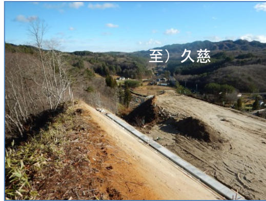
④沼袋北地区道路改良工事 施工:昭栄建設(株)