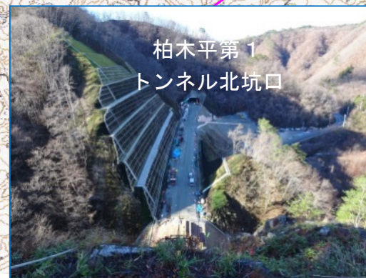
①柏木平地区トンネル工事 施工:青木あすなる建設(株)

本線盛土の前の軟弱な地盤の改良を終えています。三陸道路の両側(山側と海側)を結ぶ通路函渠も概ね出来てきました。