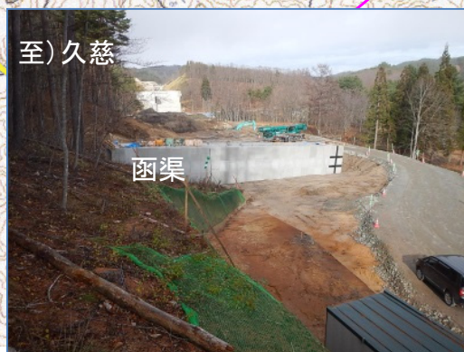
④沼袋北地区道路改良工事 施工:昭栄建設(株)