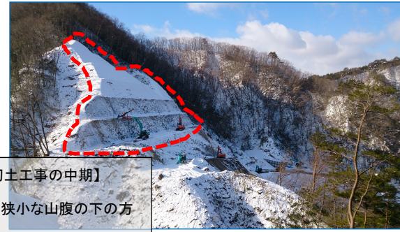
【切土工事の中期】 ⇒急峻・狭小な山腹の下の方 に切り取りが進んでいます。