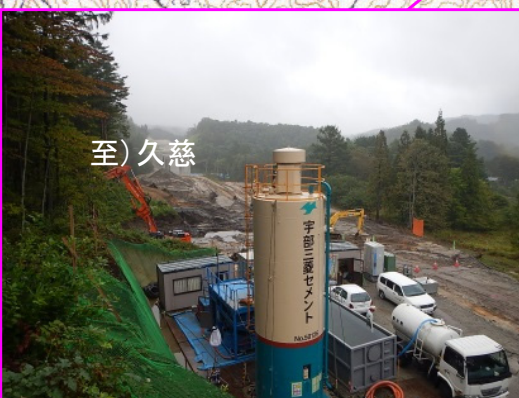
④沼袋北地区道路改良工事 施工:昭栄建設(株)