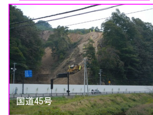
③普代南地区改良工事 施工:青木あすなる建設(株)

橋台は基礎工事中で、硬い地盤のために火薬発破を使用し、国道45号の一時止め通行規制(1回5分間程度)を行っています。