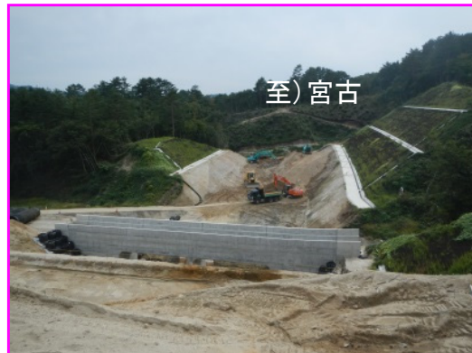
④沼袋北地区道路改良工事 施工:昭栄建設(株)