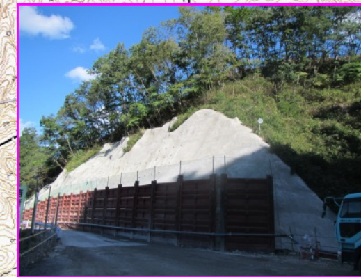
③普代南地区改良工事 施工:青木あすなる建設(株)