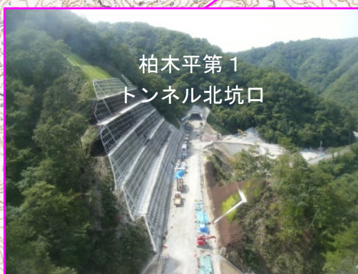
①柏木平地区トンネル工事 施工:青木あすなる建設(株)