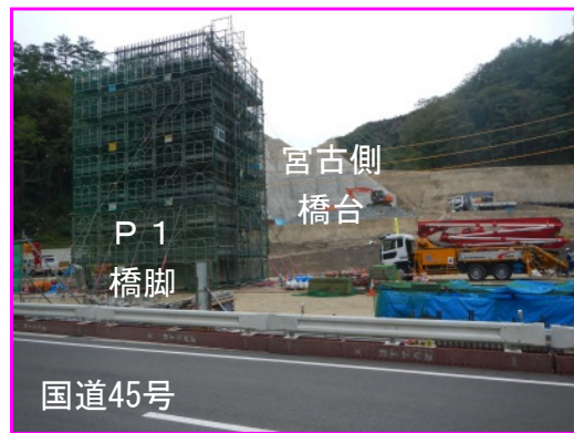
②新柳瀨橋下部工工事 施工:(株)福田組