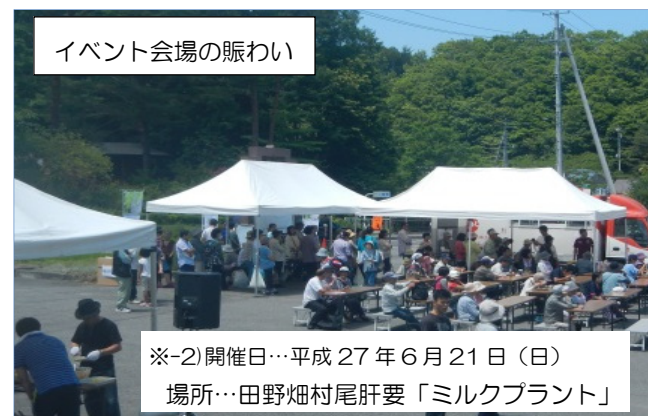
※-2) 開催日…平成27年6月21日(日) 場所…田野畑村尾肝要「ミルクプラント」

人気シェフの伊藤勝康さんの地元食材を使ったクリームパスタに長い行列。美味しくいただきました。