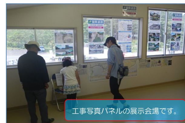
工事写真パネルの展示会場です。

イベント当日は、天候にも恵まれ数多くのお客さまで賑わいました。安全連絡協議会では、地域の皆様から建設工事へのご理解とご協力をいただいていることに感謝の気持ちを込めて、会場整備のお手伝いをすると共に、新しいイベント名称の会場表示幕の掲示に協力いたしました。