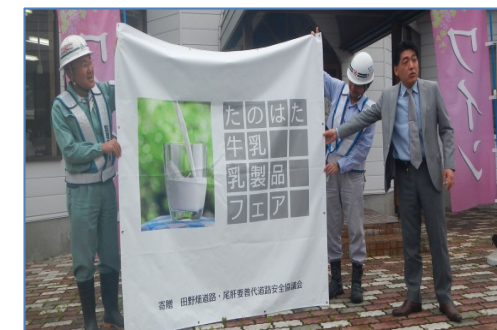
新しいイベント名称の会場表示幕の贈呈です

三陸沿岸道路の事業者等で構成する安全連絡協議会(※-1)では、田野畑村産業開発公社が昭和63年から「たのはた牛乳まつり」として主催し、今年から「たのはた牛乳乳製品フェア」(※-2)として新たにスタートしたイベントに連携して、会場整備(草刈り清掃等)や工事写真パネル展等に取り組み、地域との連携や交流を深めました。