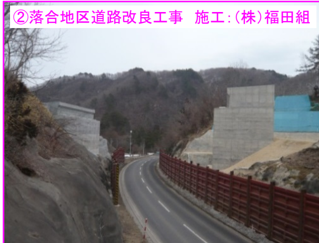
国道を跨ぐ(仮)芦渡二道橋を支える橋台が完成しました。