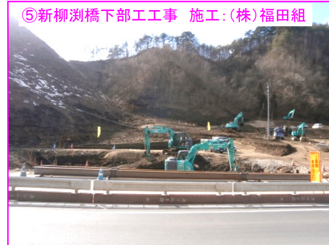
国道を跨ぐ橋の土台(橋脚)を造るため掘削を行っています。