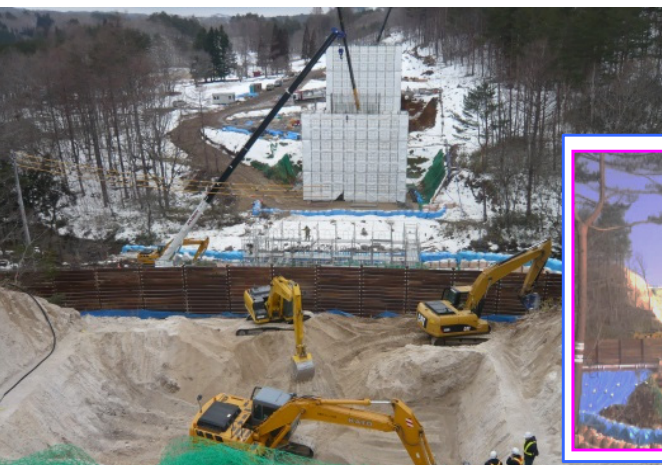
普代川と県道を渡る橋を支える橋台・橋脚の鉄筋・型枠の組み立てが進み、写真手前では橋台を造るための掘削作業を行っています。