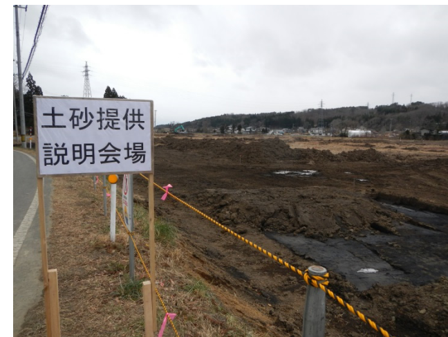
久慈市と野田村にまたがる「宇部川地区ほ場整備事業」

今回、岩手県が久慈市宇部町・野田村野田で実施中の復興事業「宇部川地区ほ場整備事業」への農地整備の地盤改良のための土砂提供の要望に対し、三陸沿岸道路『尾肝要普代道路』滝ノ沢地区の道路工事からの発生土約3万1千m 3 を提供することとなり、平成26年12月16日、現地にて概要説明会が開催されました。