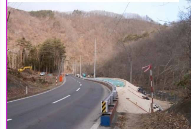
⑤新柳瀨橋下部工工事 施工:(株)福田組

国道を跨ぐ橋の橋脚を作るために、一時的に国道を切り回す工事を行っています。交通規制を行いますがお協力をお願いします。