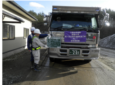
▲土砂の積載量は毎日チェックしています