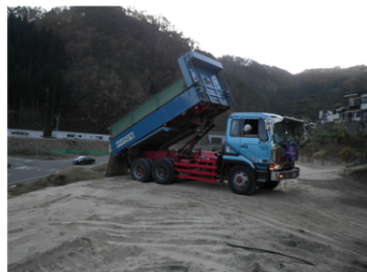
▲掘削土(真砂土)は、他工区の盛土材や復興事業に提供しています