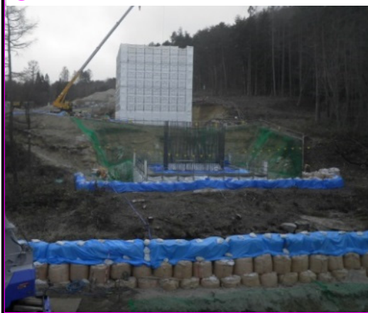
④新一の渡橋下部工工事 施工:(株)森本組

普代川と県道を渡る新一の渡橋の橋台の鉄筋・型枠の組立てと2基の橋脚の床掘りを行っています。