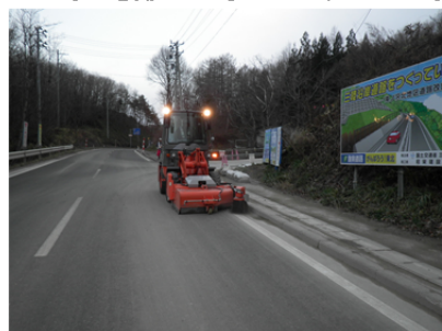
▲道路の清掃状況です