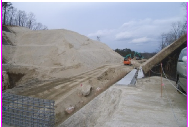
⑥滝ノ沢南地区道路改良工事 施工:昭栄建設(株)