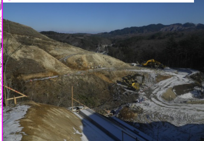
⑦沼袋地区道路改良工事 施工:(株)森本組

山を掘削し整形した切土のり面に、種を含んだ土を吹付ける仕上げの作業に入りました。【土砂提供】