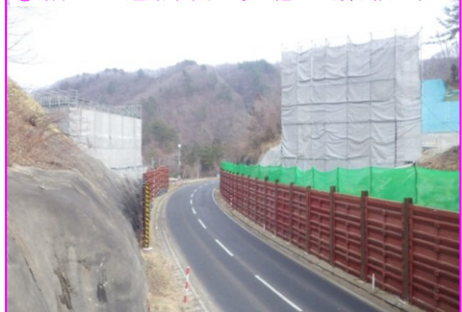
②落合地区道路改良工事 施工:(株)福田組

国道を跨ぐ芦渡こ道橋の橋台の型枠と鉄筋を組み立てています。合わせて盛土工事も進んでいます。