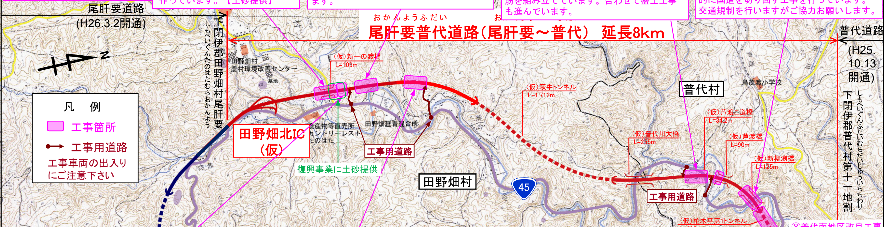
①滝ノ沢北地区道路改良工事 施工:昭栄建設(株)

国道を跨ぐ橋の橋脚を作るために、一時的に国道を切り回す工事を行っています。交通規制を行いますがお協力をお願いします。