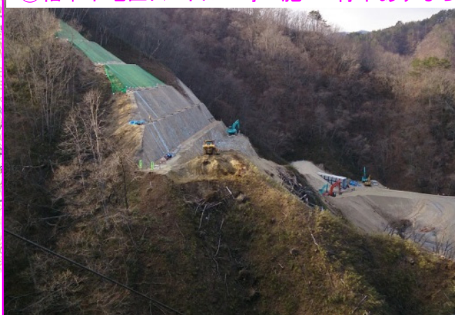
③柏木平地区トンネル工事 施工:青木あすなる建設(株)