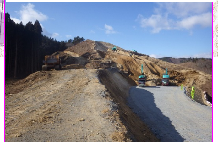
④田野畑北地区道路改良工事 施工:(株)新井組

山を掘削する切土工事を行っています。国道45号から平井賀川を渡って現場へ進入するための工事用道路にも着手しています