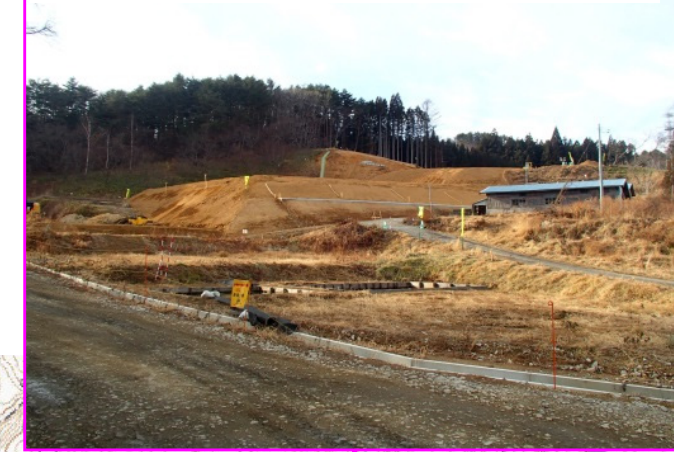
⑤菅窪地区道路改良工事 施工:樋下建設(株)

本線の下に道路と水路を通すための函渠(トンネル)が完成し、土を盛る工事を開始しています