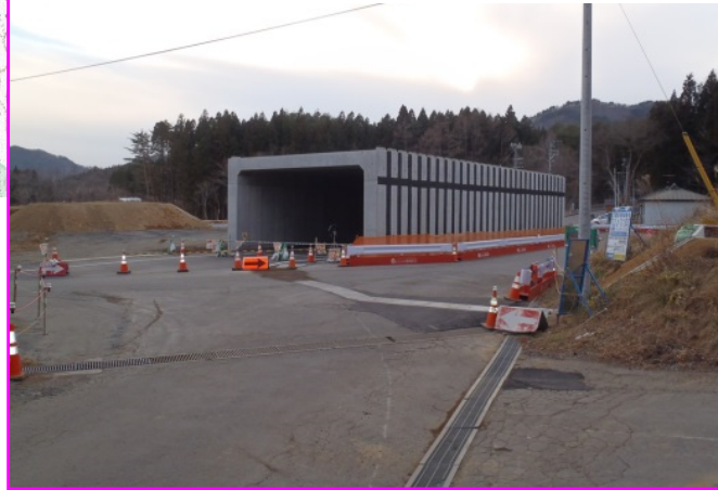
②田野畑南地区道路改良工事 施工:熊谷建設(株)

本線の下に村道大芦切牛線を通すための函渠(トンネル)の据付けが終わり、電線や水道などの切替え工事を進めています