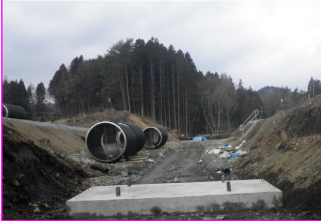
①大芦南地区道路改良工事 施工:(株)森本組