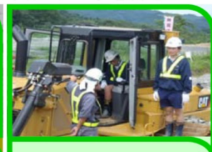
田野畑中学校職場体験学習

平成26年8月5日、地元の田野畑中学校の生徒二人が、重機の操作等を体験しました。将来建設業の担い手となる事を期待します。