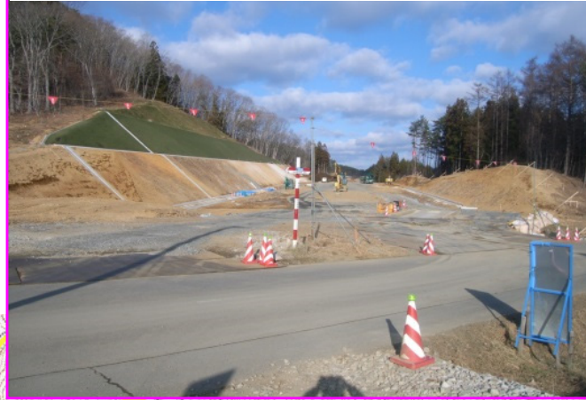
③菅窪南地区道路改良工事 施工:小野新建設(株)