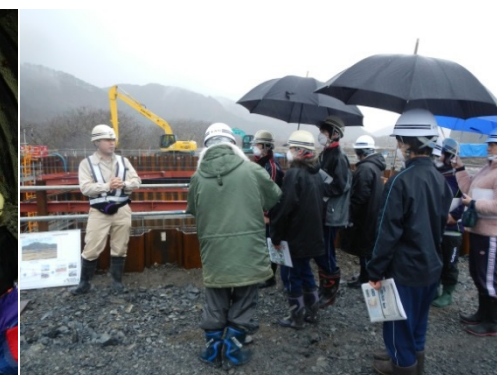
新小本大橋の下部工工事を見学