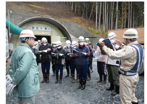
三陸沿岸道路と小本トンネルについての説明