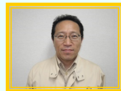
(工事責任者:内田 裕二)

朝晩の冷え込みが身にこたえる時節となりました。皆様如何お過ごしでしょうか。本工事が地域の復興を加速させる礎となる様に、現場員一同、安全施工を第一に早期完成を目指し努力して参りますので、引き続き工事へのご理解とご協力の程、よろしくお願い致します。