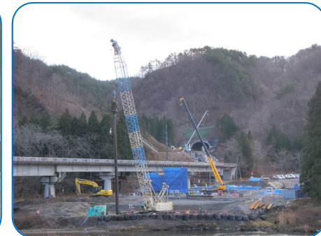
新小本大橋施工状況