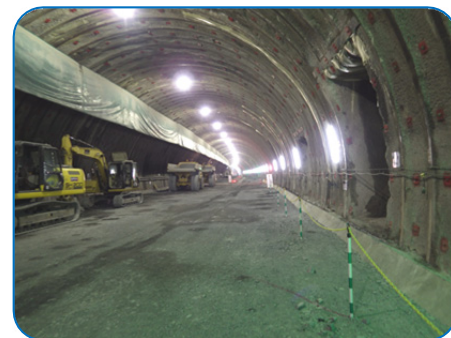
小本トンネル(南側施工状況)

国道45号 小本道路工事では、小本トンネル、新小本大橋下部工他工事を施工中です。小本トンネル(1,134m)は田老岩泉道路の早期開通を目指し、両側から掘削します。南側(宮古側)からは約400m掘削完了し、また、北側(岩泉側)からも本格的なトンネル掘削が始まりました。三陸鉄道・小本川を越える新小本大橋の下部工事についても杭の施工を完了し、コンクリート工事が本格化しています。工事の施工にあたっては、トンネル坑口に防音扉を設置する等、周辺環境に配慮した施工に努めています。