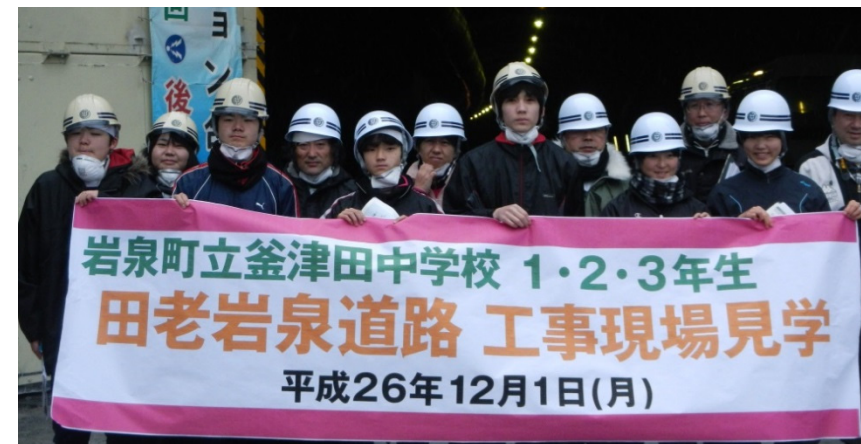
岩泉町立釜津田中学校の皆さん

当日は、あいにく小雨の降る肌寒い天気でしたが、10時30分より約1時間、岩泉町内の小本トンネルや新小本大橋の工事現場を見学されました。なかなか入る機会のないトンネルの掘削現場等では非常に興味を持った様子で、皆さん熱心に説明を聞き、小人数ながらたくさんの質問をいただきました。急ピッチで進む岩泉町の復興の現状を肌で感じていただけたようでした。