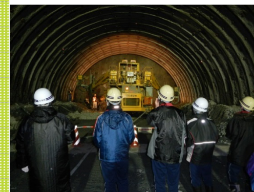
トンネル内に入り、トンネルの仕組みや掘削機械を見学