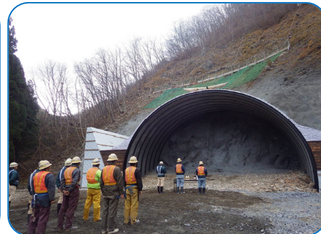
小本トンネル(北側施工状況)