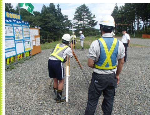
測量機械で測点の位置、高さを計測 しました