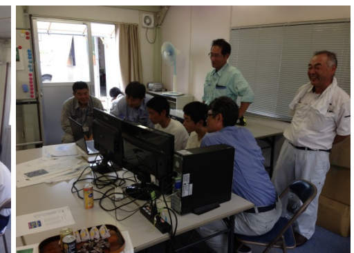
CAD講習 コンピュータを使って作図をしました