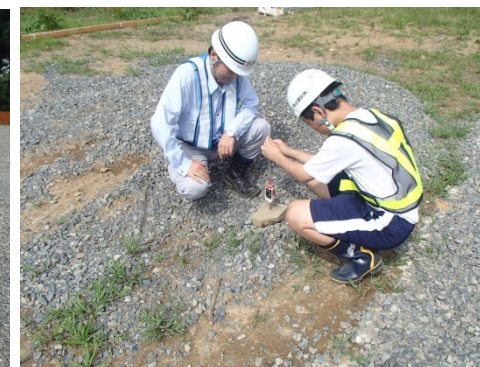
計測する測点を示しています