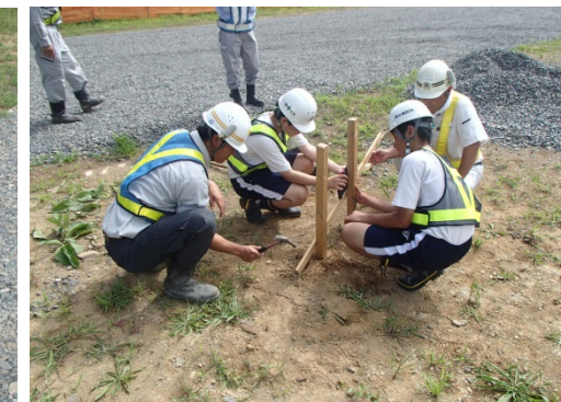
測量結果を基に丁張り(切土や盛土の 基準とするもの)を作成しました