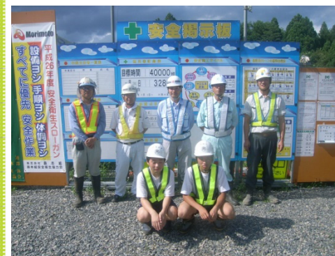
田野畑中の2名(前列)と 講師を務めた安全協議会メンバー