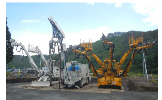
トンネルを掘る機械も展示されました