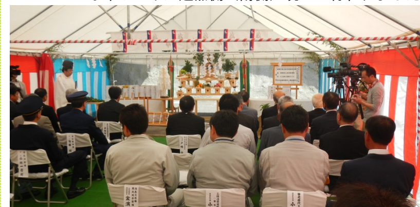
多くの関係者や地元の代表者に参加いただきました