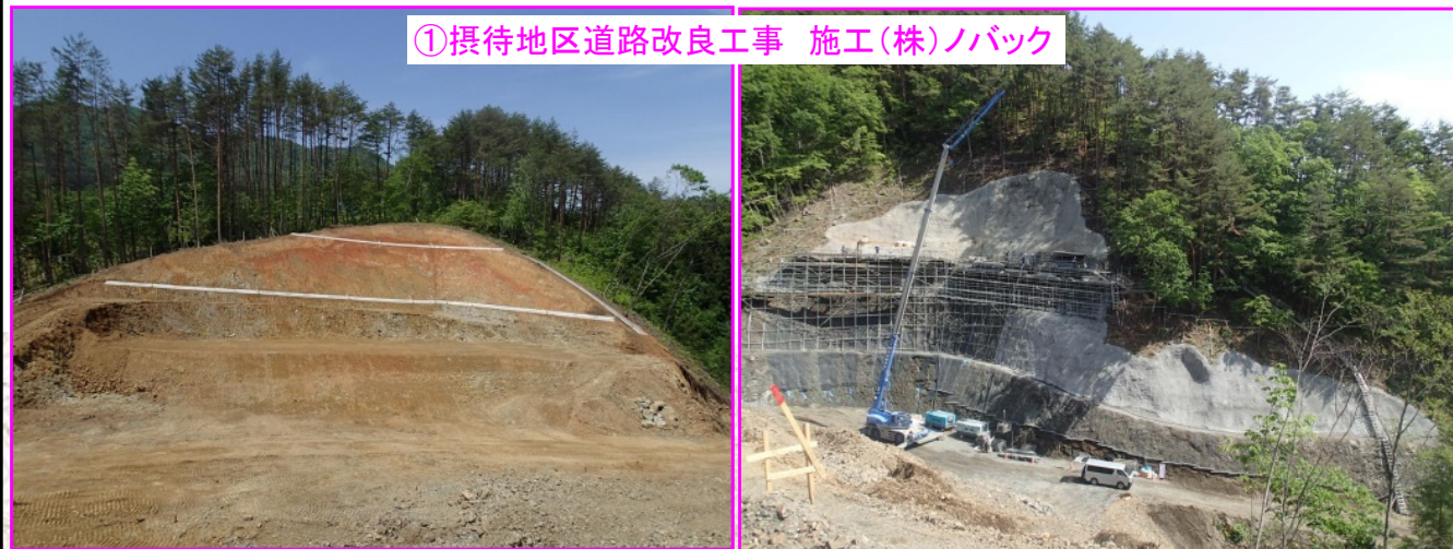
① 摂待地区道路改良工事 施工(株)ノバック

山を掘削して、本線の切土のり面を作っています。隣接して盛土の工事も進んでいます。