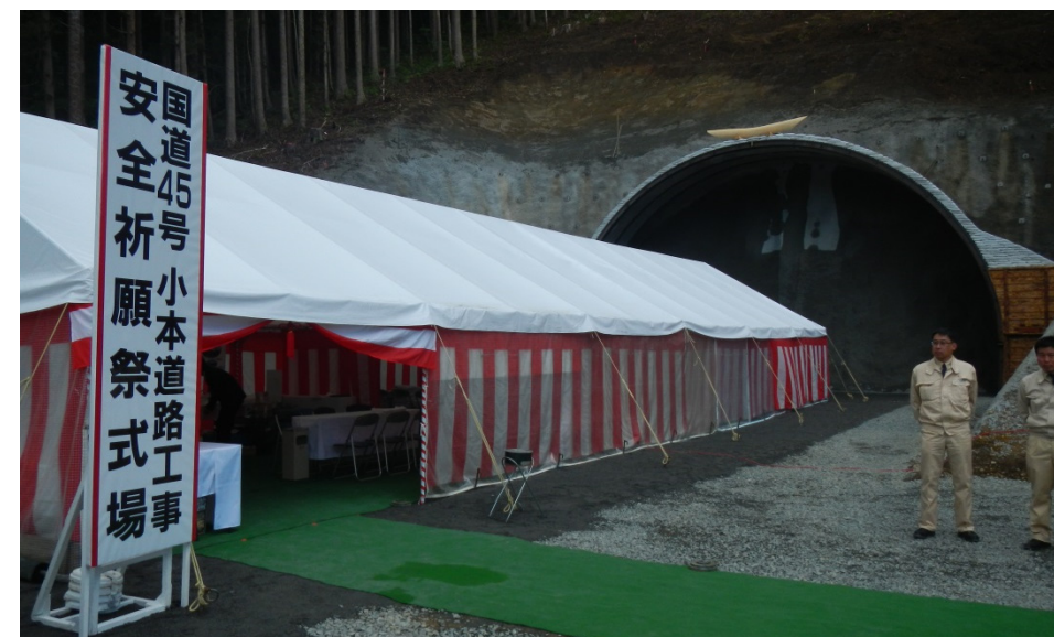
小本トンネル起点側(南側)坑口で行われました

当日は、伊達岩泉町長を始め、地域の代表の方々も出席され、工事の安全を祈念して、神事が執り行われました。