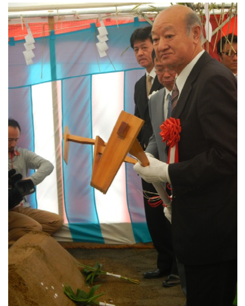
伊達 岩泉町長らによる鍬入れ