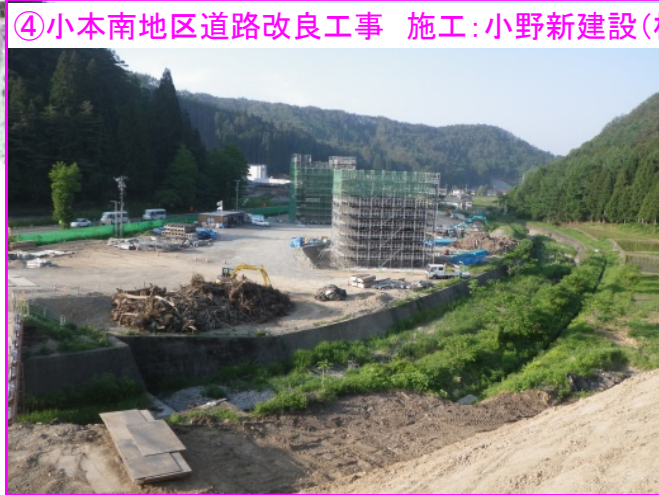
④ 小本南地区道路改良工事 施工:小野新建設(株)

国道45号を切替えるための新たな道路と国道45号やICランプ、小成川を跨ぐ新小成橋を作っています。橋脚の型枠が組み上がってきました。