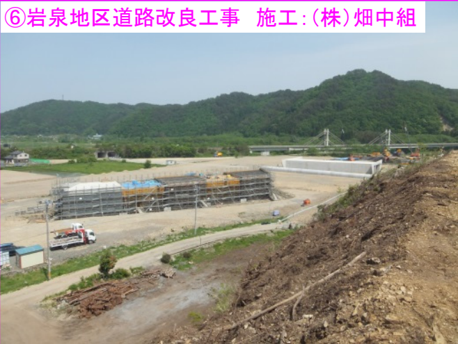
⑥ 岩泉地区道路改良工事 施工:(株)畑中組

国道45号を切替えるための新たな道路と国道45号やICランプ、小成川を跨ぐ新小成橋を作っています。橋脚の型枠が組み上がってきました。