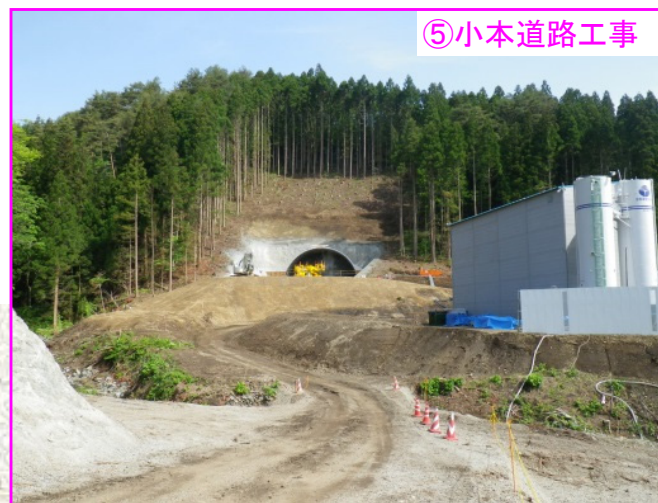
⑤ 小本道路工事 施工:西松建設(株)

安全祈願をし、まずは起点側坑口から小本トンネルを掘り始めました。周辺環境に配慮しながら掘削しています。