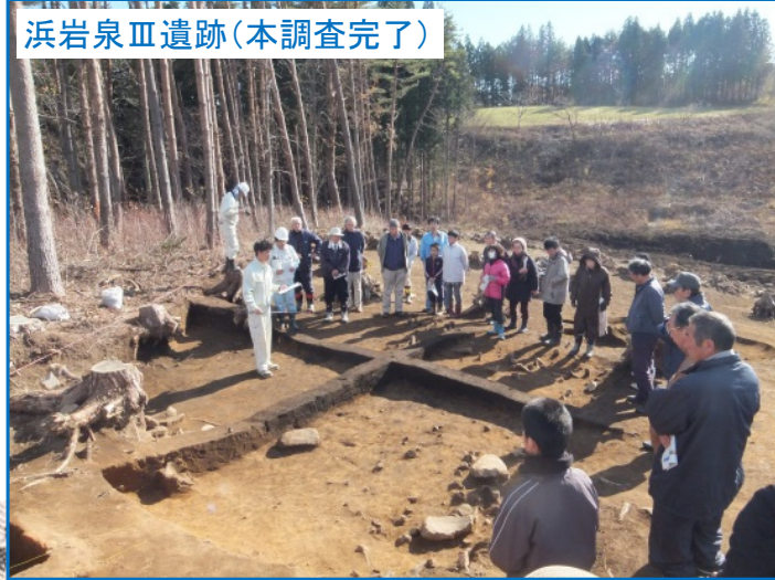
浜岩泉Ⅲ遺跡(本調査完了)