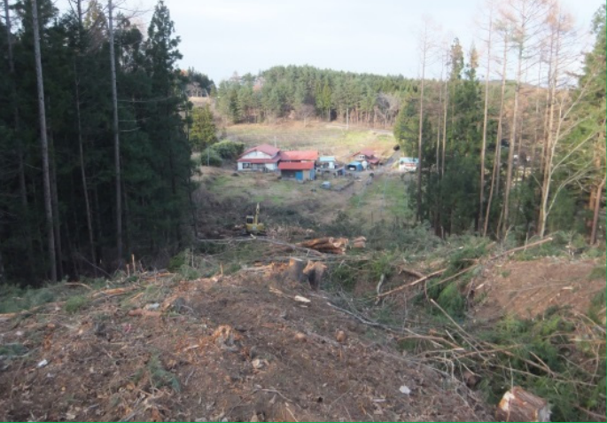
菅窪地区(伐採作業完了)