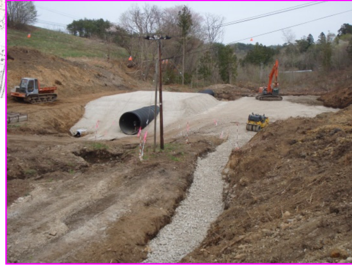
菅窪地区(伐採作業完了)