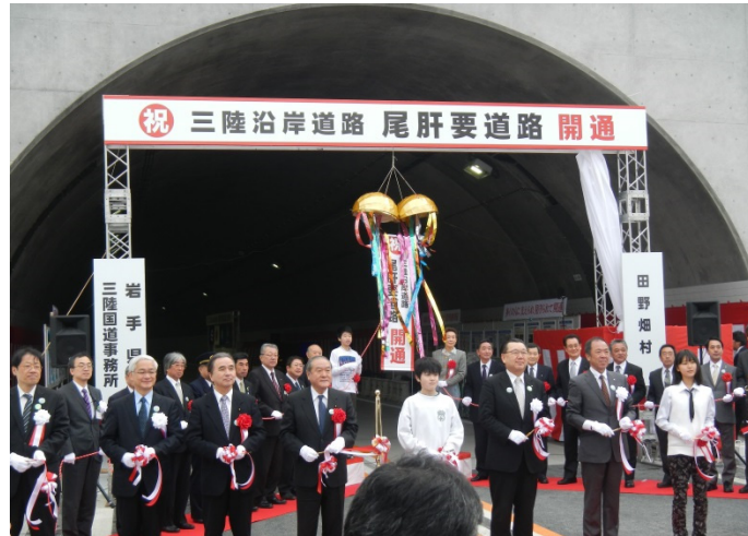
開通を祝し、テープカットとくす球開披

三陸沿岸道路『尾肝要道路』が、平成26年3月2日(日)の15時に開通しました。これにより、急カーブ急勾配や幅の狭い区間が連続し、最大の難所であった閉伊坂峠が解消されました。