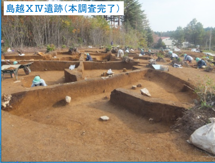
島越XⅣ遺跡(本調査完了)