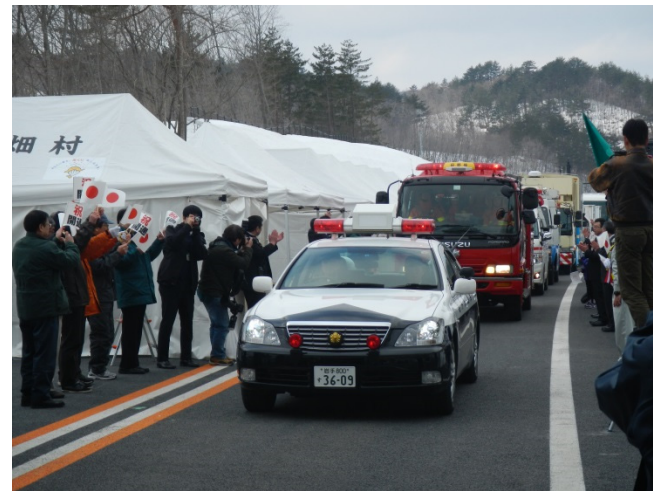
パトカーの先導により開通パレード