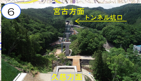
普代川に橋を架ける為の仮設の支柱を工事中です。