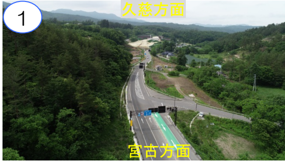
国道45号を切回す準備中です。