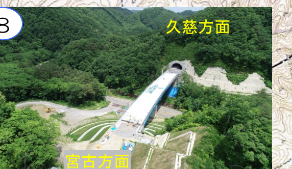
新柳瀨橋の床版を工事中です。