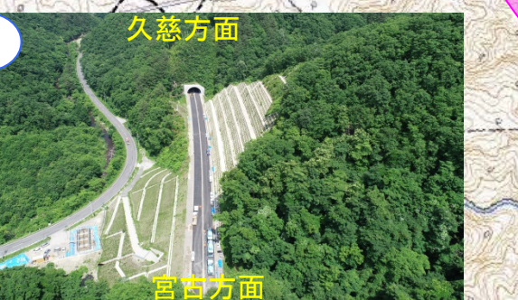
舗装の一部を工事中です。