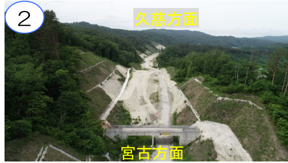
工事の準備中です。