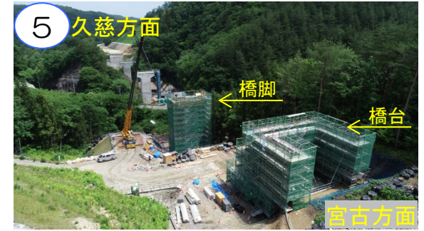
普代川大橋の橋台・橋脚を工事中です。