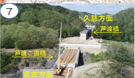
芦渡二道橋と芦渡橋の床版を工事中です。