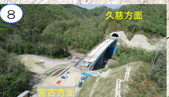
新柳瀨橋の床版を工事中です。