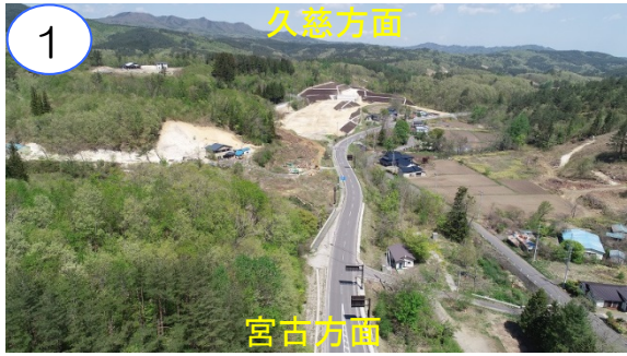
工事の準備中です。