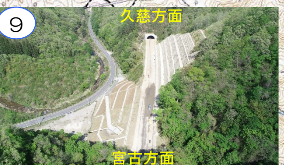
舗装の一部を工事中です。