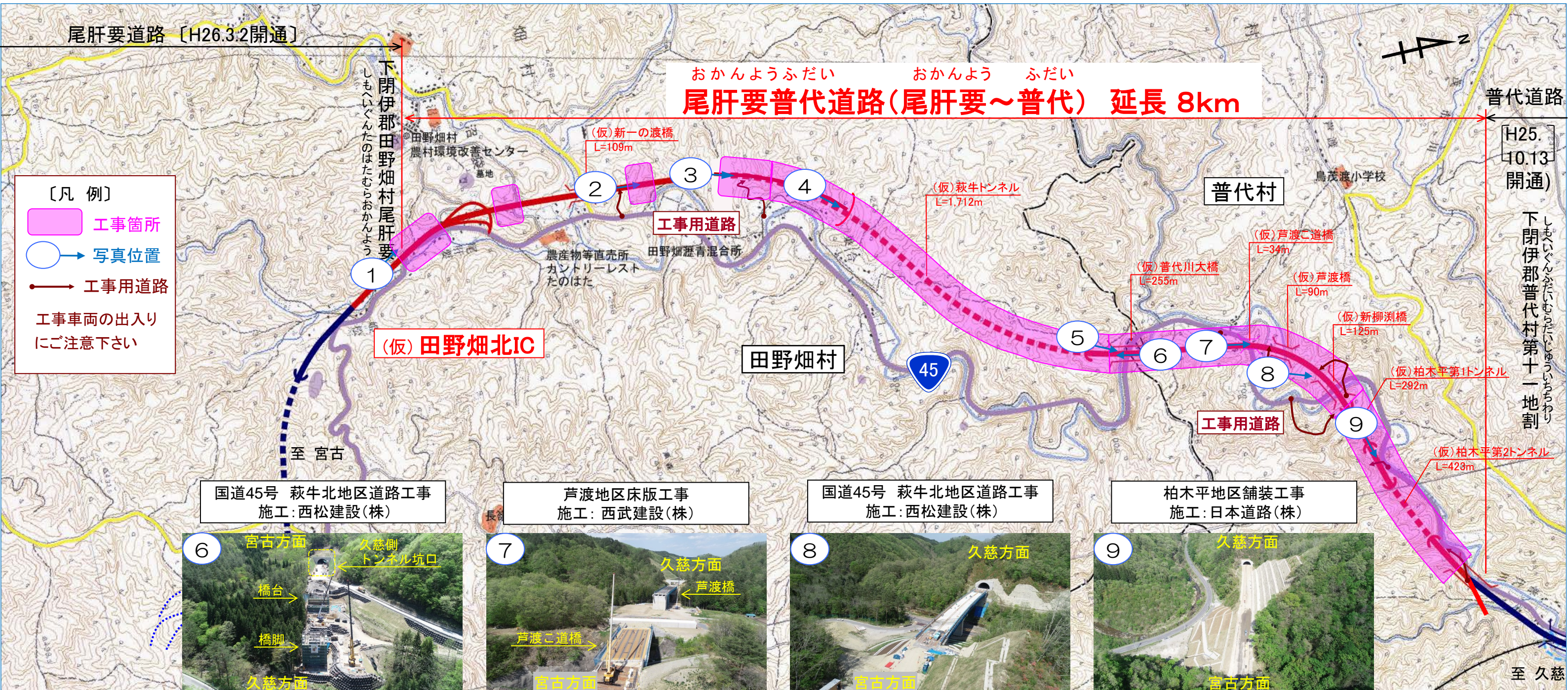
国道45号 萩牛北地区道路工事 施工：西松建設(株)