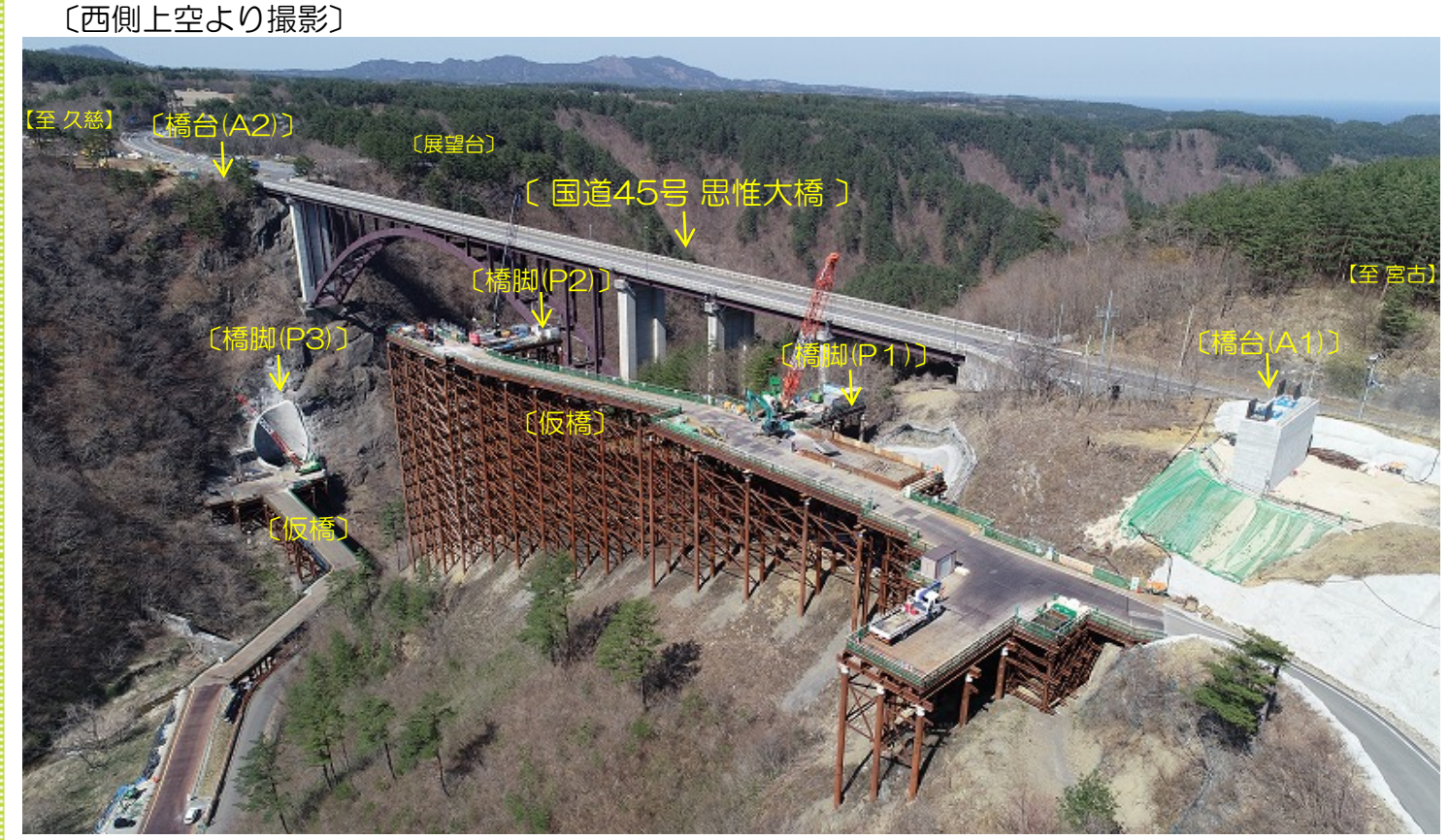
仮橋から橋脚の作業を行っています。

～「新思惟大橋下部工工事」が進んでいます～ 三陸沿岸道路の整備による、新思惟大橋の工事を進めています。久慈市側の橋台工事も始まり、全ての橋台・橋脚を工事しています。