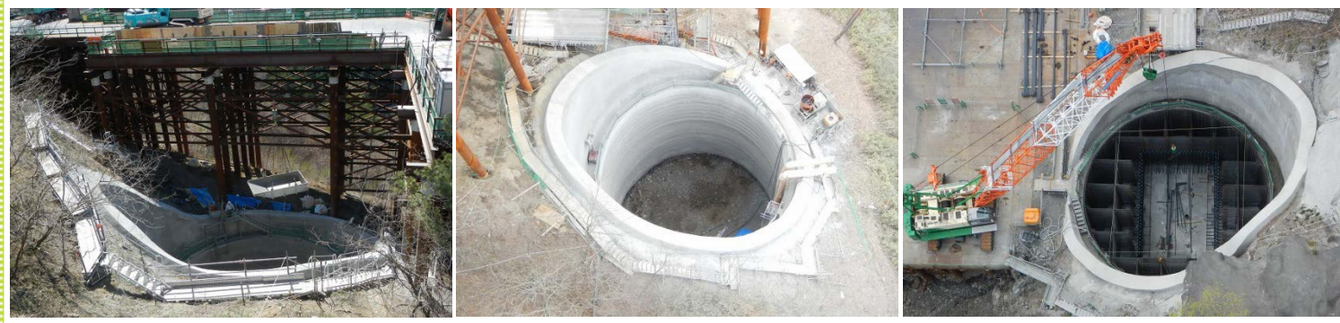
〔思惟大橋より撮影〕 宮古市側の橋脚(P1) 中央の橋脚(P2) 久慈市側の橋脚(P3)