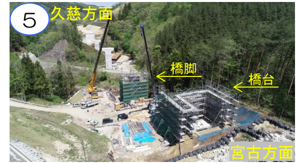
普代川大橋の橋台・橋脚を工事中です。