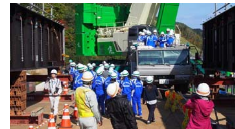
500 t吊りクレーン試乗体験