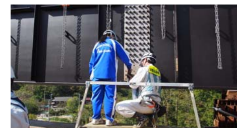
高力ボルトの締付体験

(参考) 高力ボルト(こうりょくボルト)とは高張力の鋼(はがね)で作られた強度の高いボルト(別名:ハイテンションボルト・ハイテンボルト)摩擦接合用高力六角ボルト・ナット・座金のこと。締付けは通常六角ボルトよりも高い力での締付けを行う。一度使用した高力ボルトは、もはや新品時の状態を保っていないので、再使用できない。