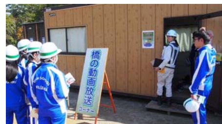
橋の動画放送コーナー