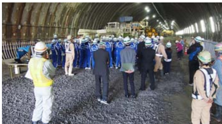
(仮) 萩牛トンネルの事業概要説明

(仮) 萩牛トンネルは延長1,712mで、尾肝要普代道路では最も長いトンネルです。