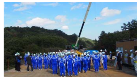
(仮) 芦渡こ道橋の事業概要説明