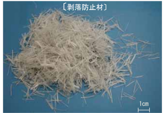
剥落防止材とは：コンクリートにひび等が入っても、落ちないように、繊維を入れて補強します。 (昔から土壁にも藁(ワ)を入れて、ひびに強くしていました。)