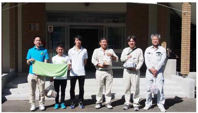
参加された有志のみなさん