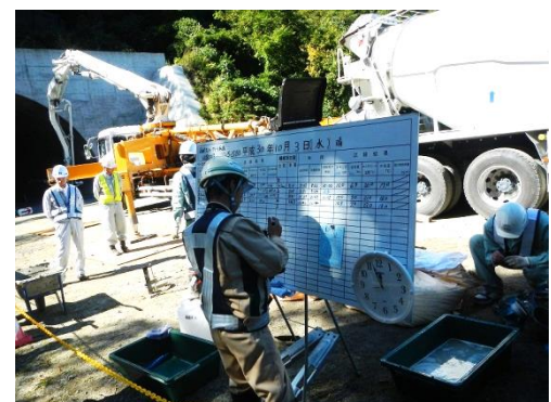
試験記録は、本工事に反映されます。