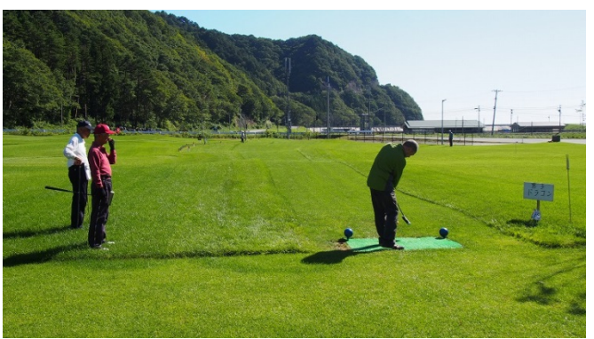
田野畑村長 試し打ち