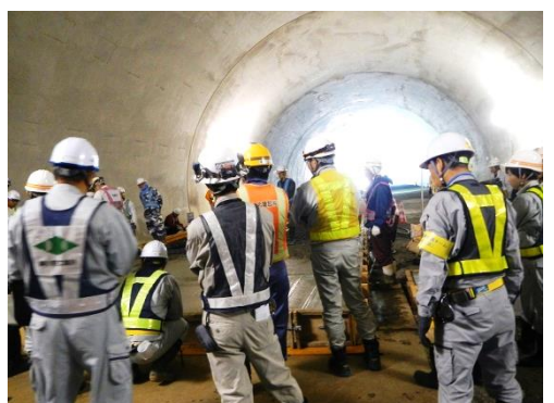
関係技術者が集まりました。