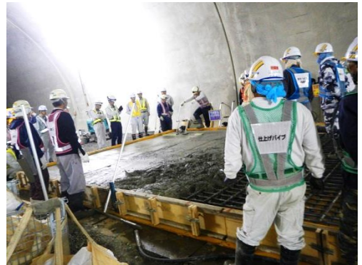
生コンクリートの打込み手間も確認します。