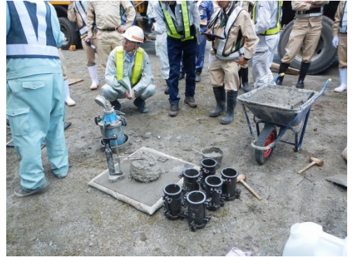
生コンクリートの性質を確認します。