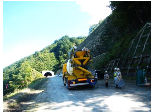
生コンクリートに、剥落防止材を混和します。