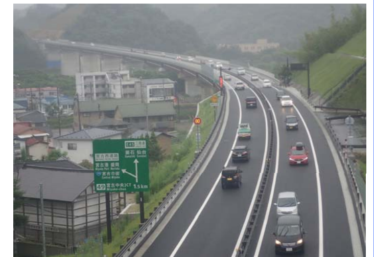
一般開放後の状況