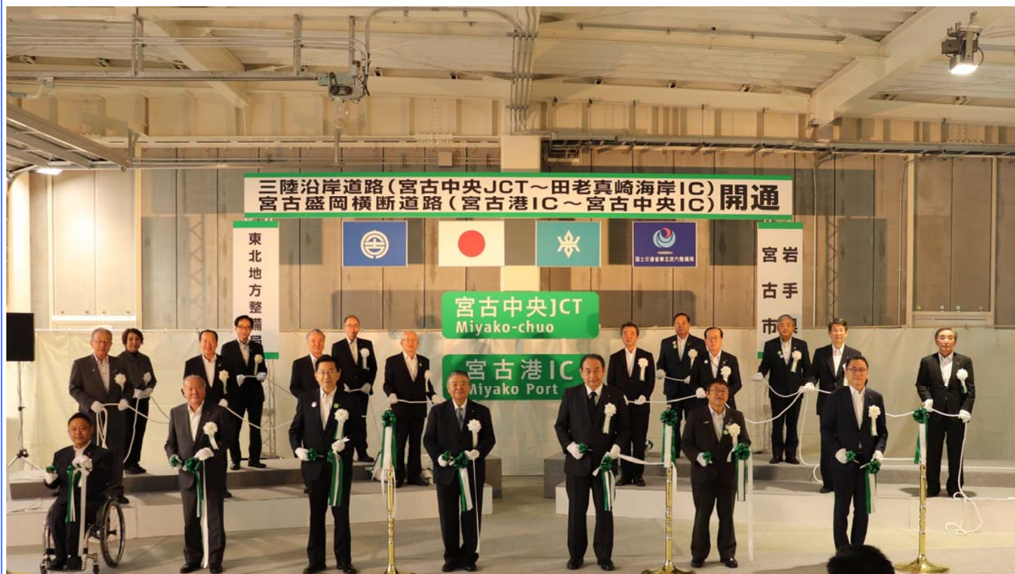
テープカットの状況

宮古老道路は平成30年3月21日に田老真崎海岸IC～田老北ICの4km区間が開通しているため、今回の開通で、 全線開通 となりました。