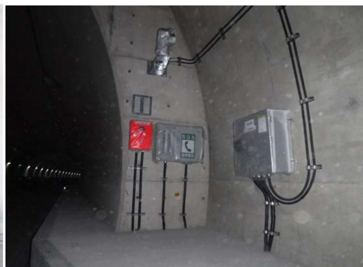
こちらは非常電話です。その名の通り緊急時に電話ができる設備です。