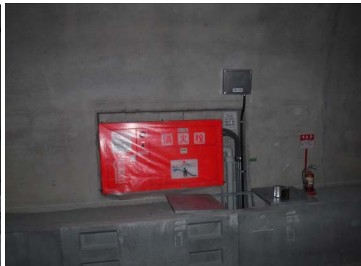
こちらは消火栓です。火災時に役に立つ設備です。給水管がついていて散水できます。