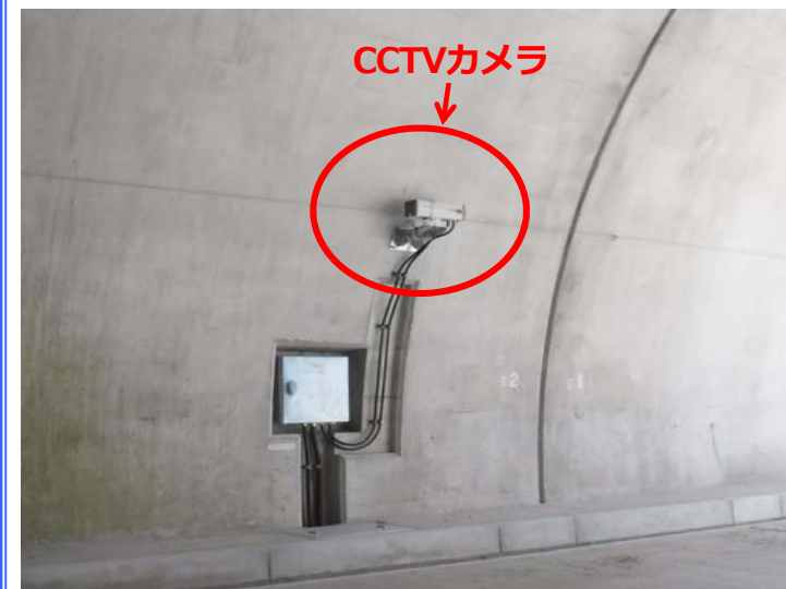
こちらはCCTVカメラです。トンネル内を常時監視している監視カメラです。