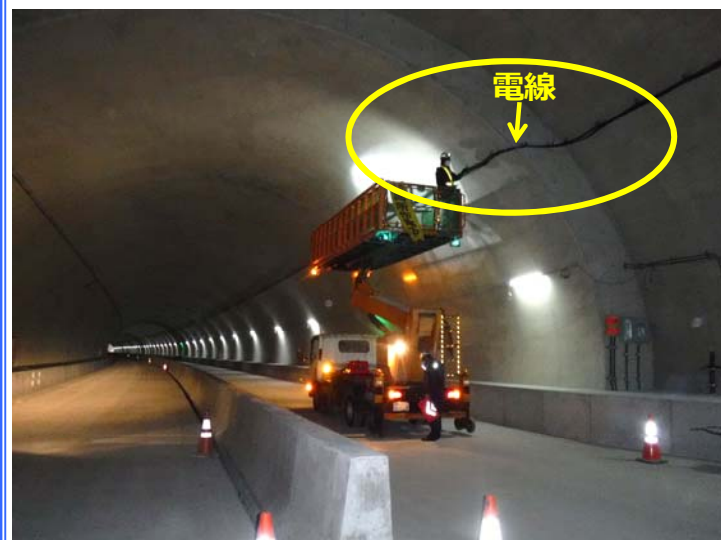
現在トンネルはこのような電線を引き込んだり、設備を取り付けています

トンネル内にいろんな設備が付いてきたのでご紹介します。普段運転しながらではどんな設備が付いているか見ることも出来ないし、気にすることも無いと思います。工事中だからこそお見せできます。緊急時にこんな設備があったと思っていいただければ幸いです。