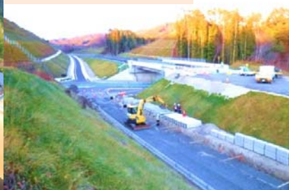
施工：⑥東亜道路工業

千徳地区で土工事をすすめています。千徳、崎山、田老地区で電気室工事をすすめています。