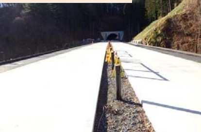
施工：⑦東亜道路工業