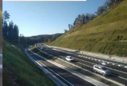
施工：⑥東亜道路工業

千徳地区で土工事をすすめています。千徳、崎山、田老地区で電気室工事をすすめています。