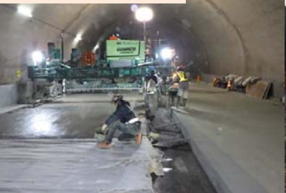
施工：⑦東亜道路工業