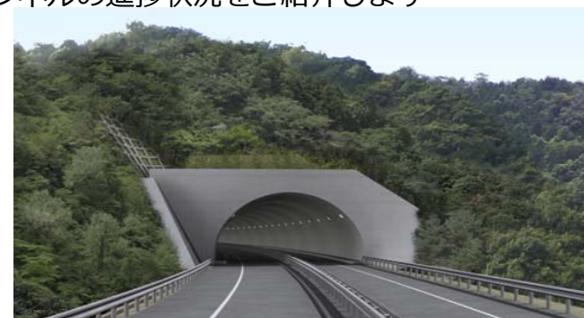
(仮)千徳トンネル完成イメージ(近内側)