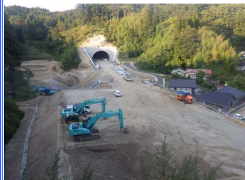
R1年9月末時点千徳側