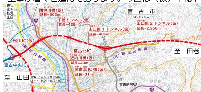
千徳トンネル位置図

宮古老道路(宮古中央IC~田老真崎海岸IC)(未開通延長=約17km)は、全線開通に向けて、工事が着々と進んでおります。今回は(仮)千徳トンネルの進捗状況をご紹介します