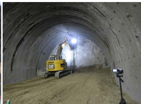
H31年3月時点トンネル坑内