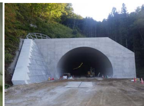
R1年9月末時点近内側

(仮)千徳トンネルは現在一部開通している宮古中央ICと宮古北ICの間にあるトンネルです。約半年前の3月にトンネルが貫通し、覆工コンクリートの施工をしてきました。今月、トンネルの出入口部(坑門)のコンクリートの施工が完了し、宮古老工区全てのトンネルが完成致しました。今後は舗装工事を進め、標識設置工事をする予定となっています。ご不便とご迷惑をおかけしておりますが、これからも工事の進捗に暖かいご支援とご協力をお願いいたします。