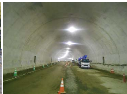
R1年9月時点トンネル坑内