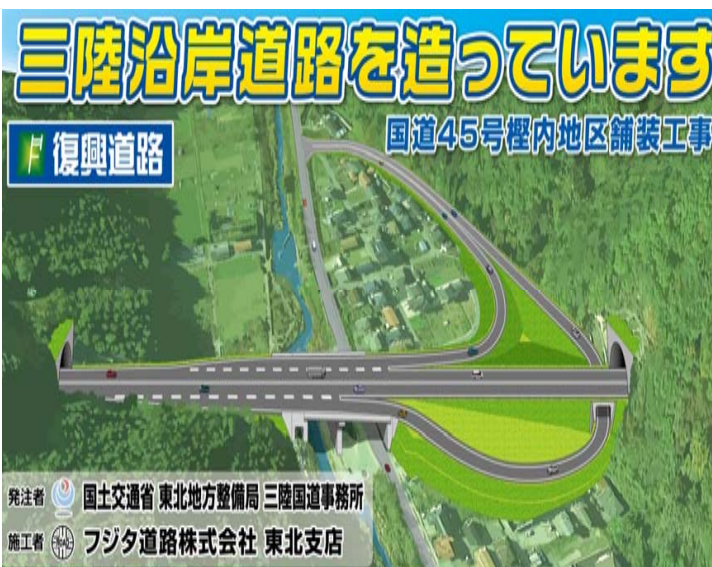
完成イメージ図（フジタ道路工事看板引用）