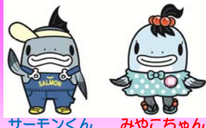
サーモンくん みよこちゃん