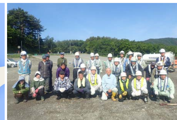
青野滝地区のみなさんと