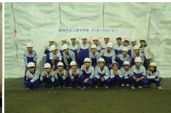
盛岡市立乙部中学校のみなさま