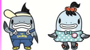
サーモンくん みよこちゃん