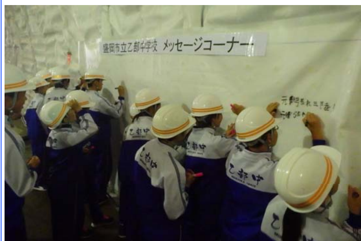
防水シートへメッセージの記入