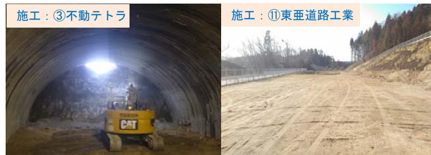
千徳地区でトンネル工事をすすめています。

平成30年6月末から本格着工し、この度3月に工事が完了致しました。特にダンプでの土砂運搬の際は最大30台程度市内を通行し、沿道住民及び、学校関係者の方々には大変ご迷惑をお掛け致しましたが、皆様のご理解ご協力のもと無事工事は完了し、厚く感謝申し上げます。今後とも、宮古田老道路へのご理解ご協力を引き続きよろしくお願い致します。