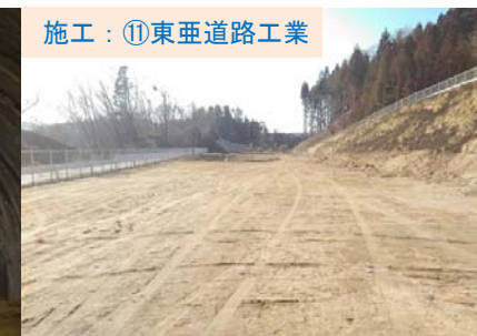
山口地区で舗装工事をすすめています。