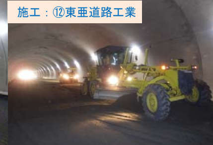
崎山地区で舗装工事をすすめています。