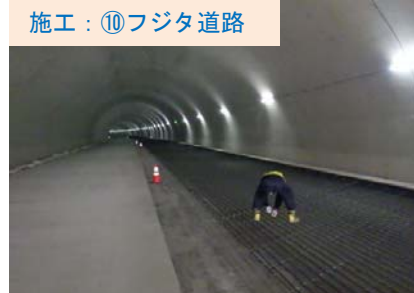
椋内第1トンネル～田老第3トンネルにかけての舗装工事をすすめています。