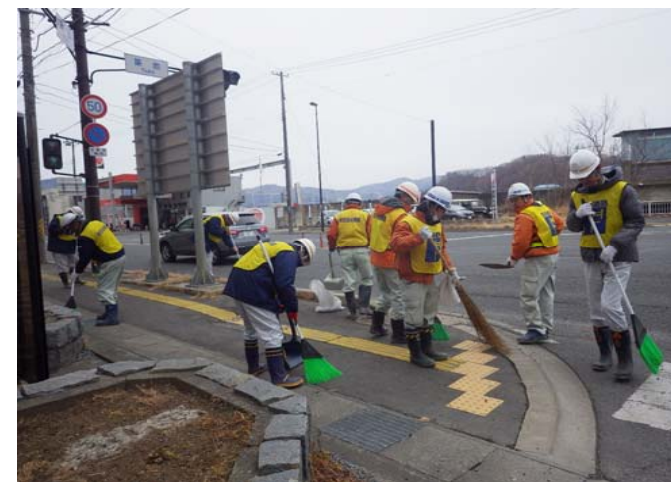
2月6日に旧市役所付近の国道を清掃しました