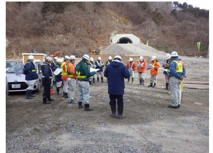
宮古労働基準監督署と共同パトロール状況

2月6日に宮古労働基準監督署をお招きして、小林西地区法面他工事を対象とした安全協議会パトロールを実施しました。パトロール後には、宮古労働基準監督署から安全講習をして頂き、よりいっそう安全意識が向上しました。