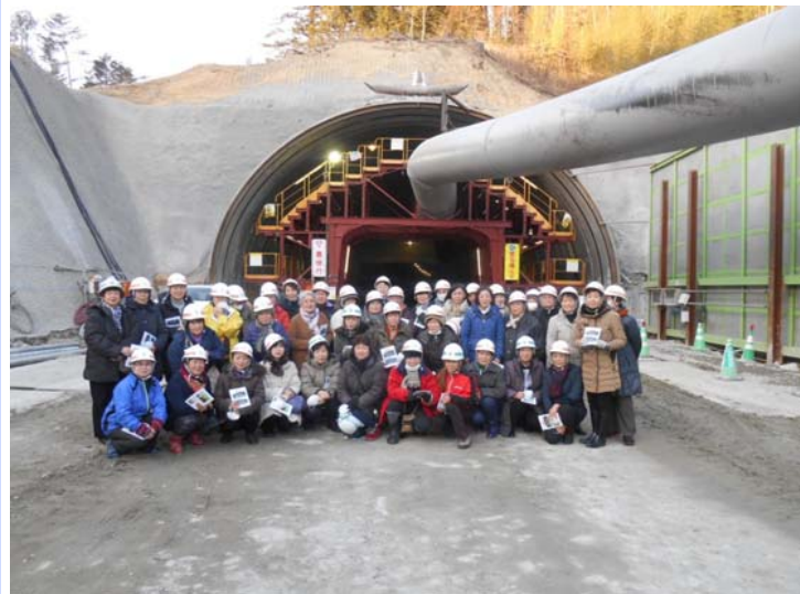
明日を拓く宮古のみち女性の会の皆さま

明日を拓く宮古のみち女性の会の皆さまに、(仮)千徳トンネルの現場に来場して頂きました。(仮)千徳トンネルではトンネルの施工状況や、トンネル工事用の機械、トンネルの構造について見学されました。見学会では、「トンネル用の大きなダンプは車の免許で運転ができるのか?」「どうやってトンネル掘削のダイナマイトは爆破させているのか?」「大きな機械や設備はどのように現場に持って来ているのか?」等の質問をたくさんして頂いて、活気ある明るい見学会になりました。またお越しく下さい。