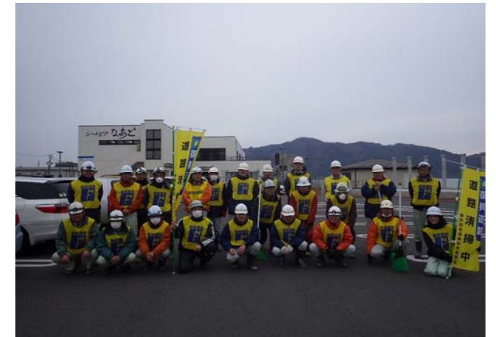
引き続き宜しくお願いします