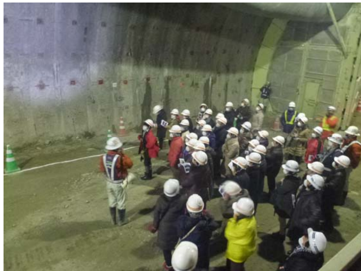
千徳トンネルの見学状況