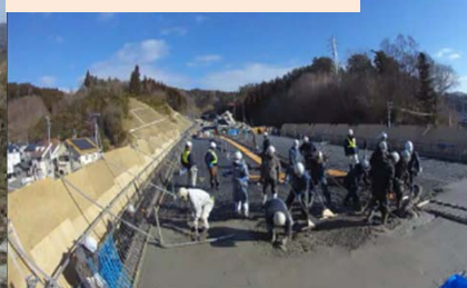
施工：④オリエンタル白石