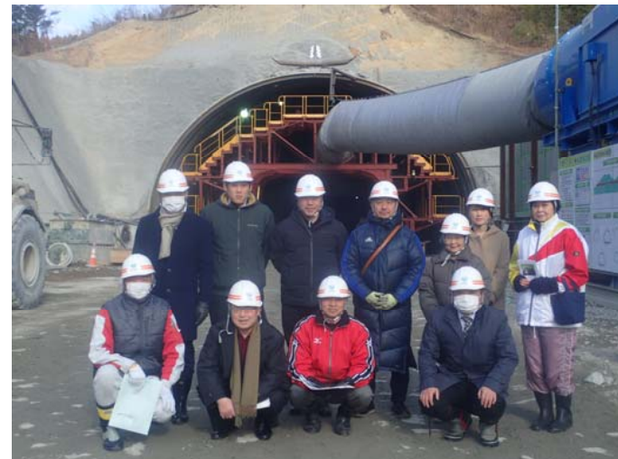
千徳トンネルを見学

千徳トンネルでは発破の瞬間に立ち会って頂きました。また、近内川橋では鉄筋の組立て状況を、宮古北ICでは盛土状況を見学し、事業の進捗を確認して頂きました。