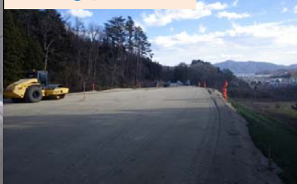
施工：⑪東亜道路工業