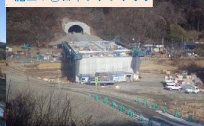
施工：⑦日本ファブテック