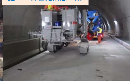
施工：⑨世紀東急工業