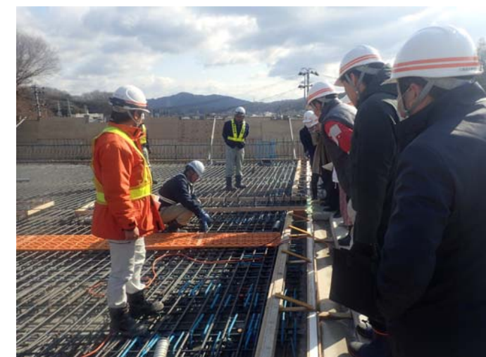
近内川橋で鉄筋の組立てを見学