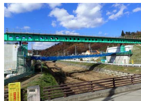
ガーダー(レール)の設置