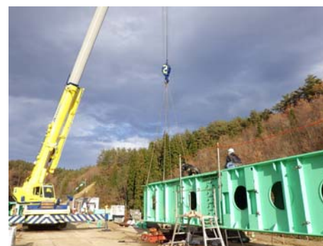
ガーダー(レール)の組立

(仮称)近内川橋は架設桁架設という工法で架設されました。はじめに架設桁(ガーダー)を渡してその上を台車を使って橋桁を引き出し、クレーンで吊って所定位置に据え付ける工法です。現在は橋の上にコンクリートの床(床版)をつくっています。