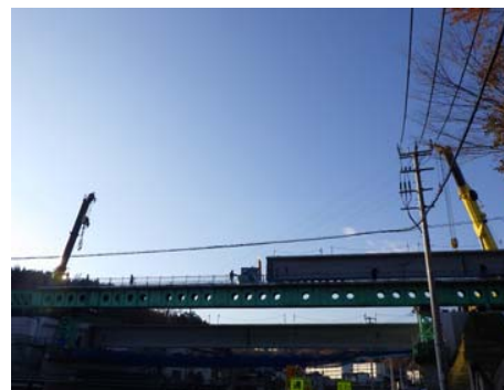
桁移動(レールの上を移動)