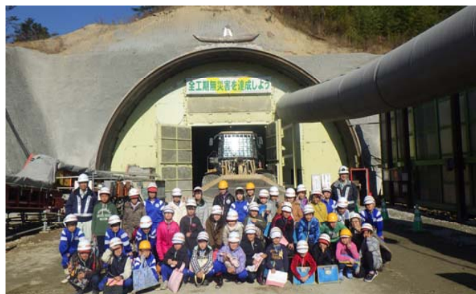
見学ありがとうございます