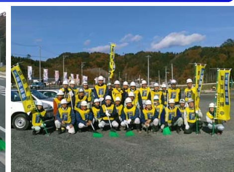
宜しくお願いします