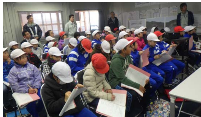
鞭牛和尚と現在の道路のつくり方の違いを勉強

(仮)山口こ線橋は児童のみんなに、橋の名前を決めて頂くことになっています。良い名前を付けて下さい。