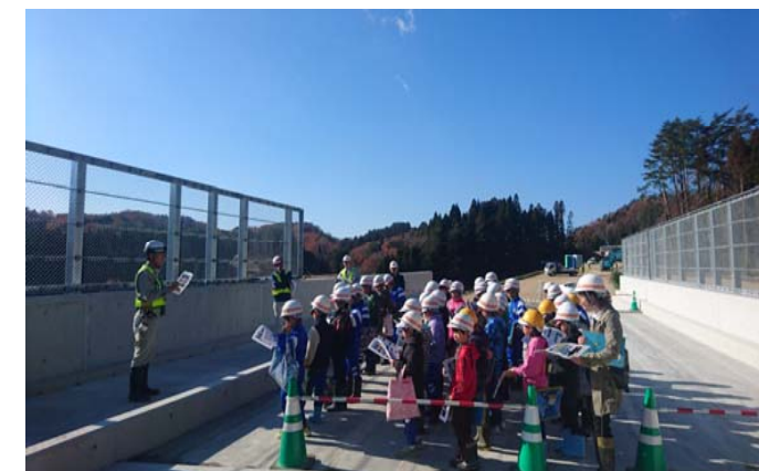
良い名前を橋に付けて下さい