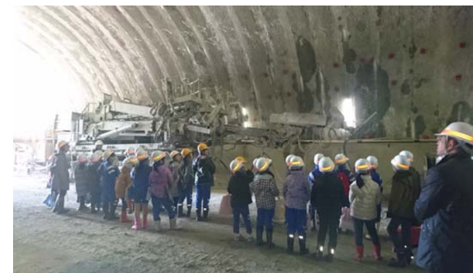
トンネル工事の機械や工事状況の見学