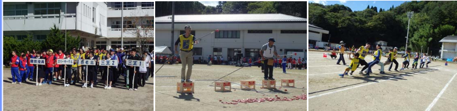
チーム名「スリーサークル」

田老第一中学校で開催された田老地区体育大会に、宮古田老道路安全協議会チームが参加しました。同大会へは第69回から毎年参加させていただいており今回は35名が出場しました。当日は台風が接近していたにもかかわらず、秋晴れで絶好の運動会日和となり、大いに盛り上がりました。