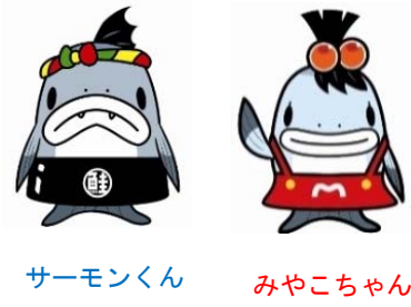
サーモンくん みやこちゃん