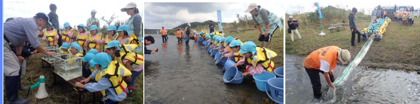
放流する魚について学びました

10月9日(火)、閉伊川漁業協同組合協力のもと、そけい幼稚園の児童をお招きし、ヤマメ等の稚魚放流会を開催しました。