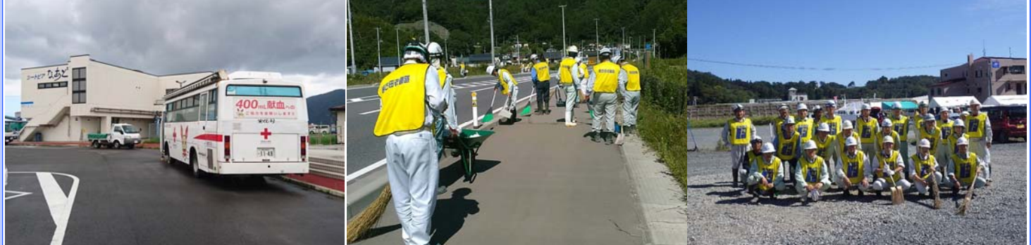
献血の様子（なあと付近） 清掃の様子（田老付近） 引き続きよろしくお願いします

今月は11日に宮古田老安全協議会の35名が、「シートピアなあど」にて献血活動に協力させていただきました。また、19日に道の駅田老付近の清掃活動を実施しました。