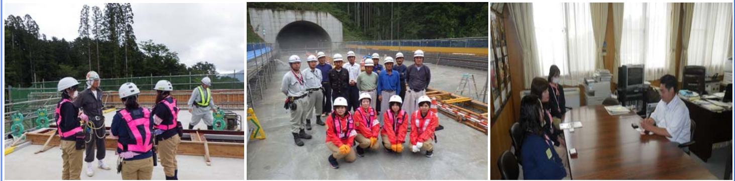
協力会社職長へインタビュー 安全に作業を進めます 三陸国道事務所所長への報告

オリエンタル白石（株）の女性社員で構成される美守隊が田の沢川橋上部工工事、近内川橋外上部工工事の両現場で安全・衛生パトロールを実施しました。協力会社職長にインタビューして、体調や食事の状況を確認するなど、日頃、男性社員が見落としがちな点をチェックしました。