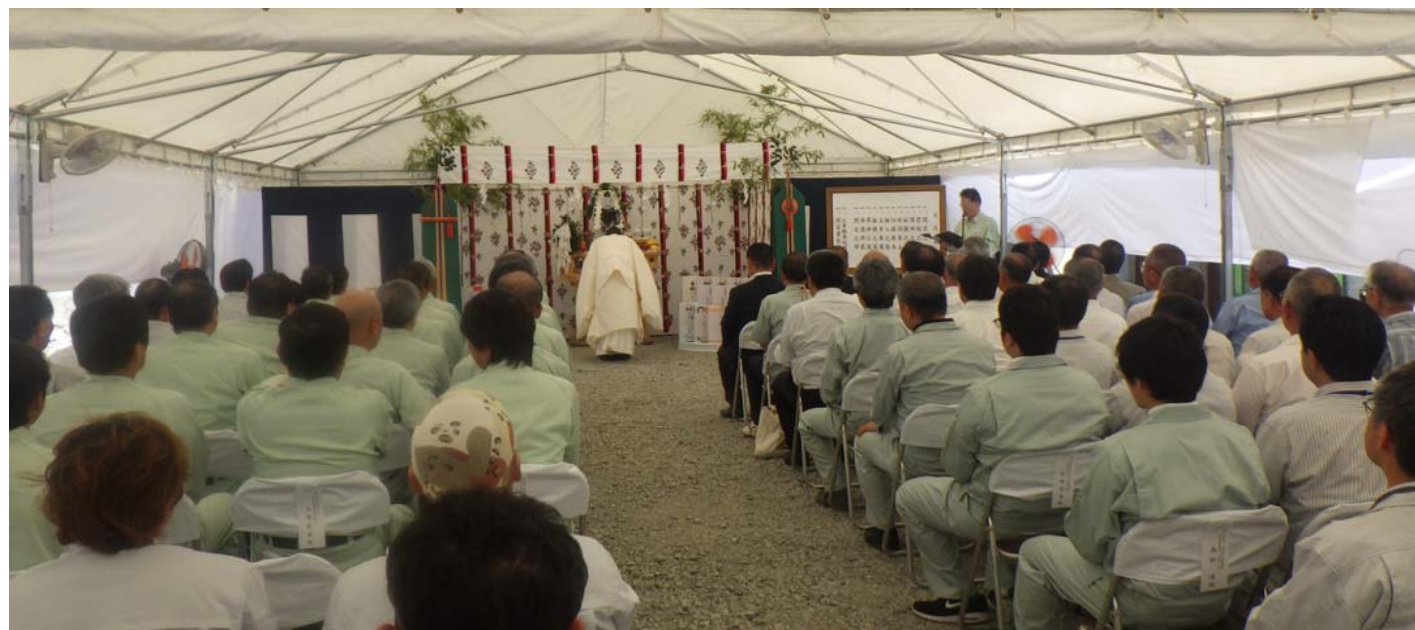
安全祈願祭の様子

(仮称)千徳トンネル(延長426m)の安全祈願祭を執り行いました。これで宮古老道路の全13本のトンネルすべてが着手されました。宮古市長をはじめ、関係機関、地域自治会の方など総勢67名の方々に参加して頂き、工事の無事故無災害での完成を祈願いたしました。