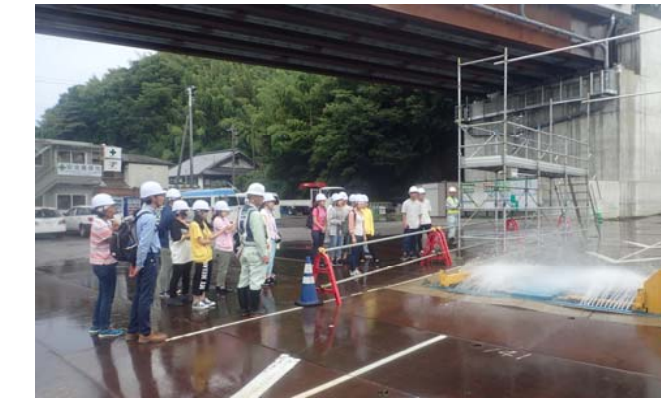
工事の設備にも興味を持つ学生