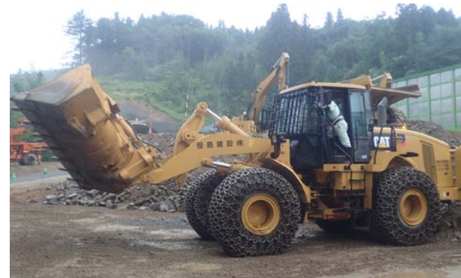
建設機械への体験搭乗