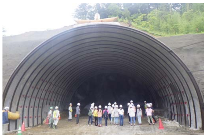
トンネル内部の見学