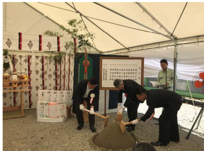
神事の様子（鋤入之儀）