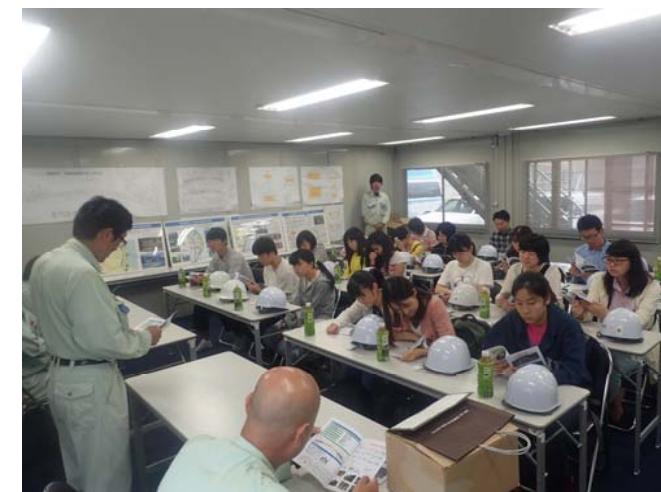
熱心に説明を聞く学生達