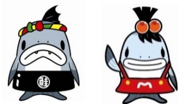
サーモンくん みやこちゃん