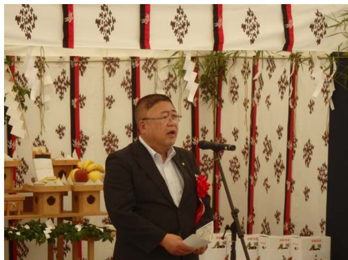
宮古市長あいさつ