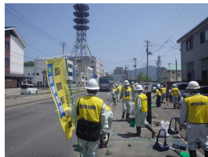
清掃の様子(市役所付近)