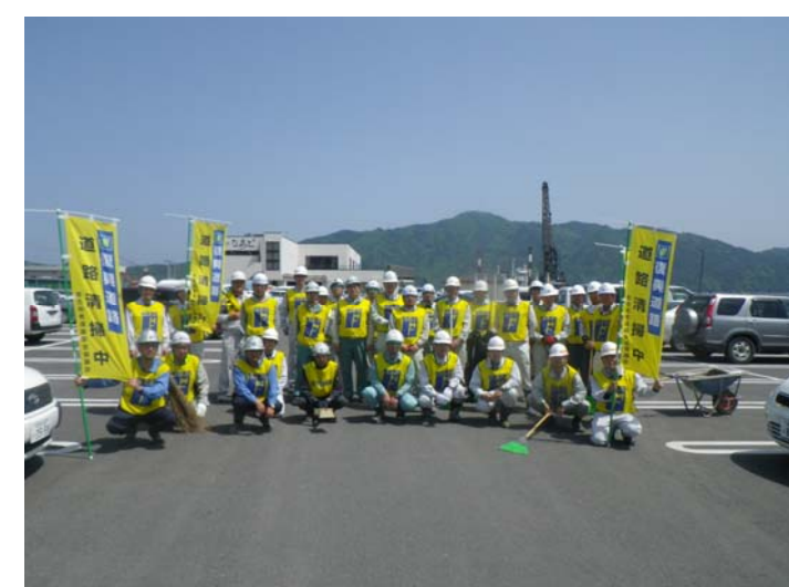
引き続きよろしくお願いいたします

ご意見・ご感想をお寄せ下さい。 国土交通省 東北地方整備局 三陸国道事務所 〒027-0029宮古市藤の川4番1号 建設監督官(宮古田老道路担当) TEL:0193-71-1745 FAX:0193-71-1738 また、工事見学のご希望がありましたら、三陸沿岸道路事業促進チーム(宮古田老工区) 三陸国道事務所東庁舎1-2 下記に記載のURLから工事見学の募集を承っております。 施工監理担当 TEL:0193-77-4731 ホームページ URL: http://www.thr.mlit.go.jp/sanriku/index.html 工事現場を見学しませんか? このバナーから募集しています。