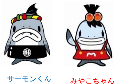
サーモンくん みやこちゃん