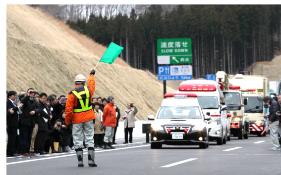
パレード出発の合図