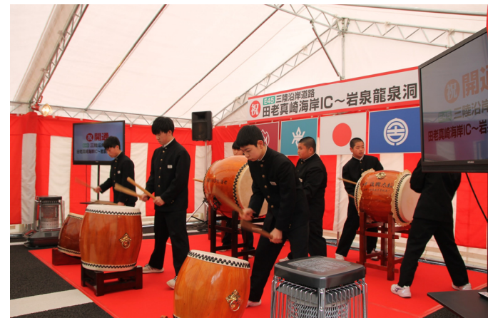
田老一中太鼓披露