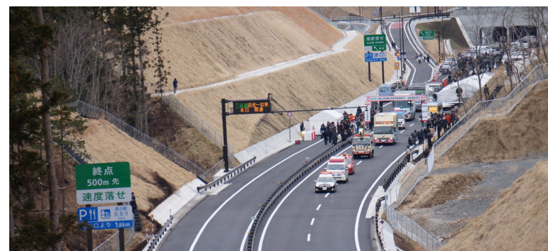
パレードスタート