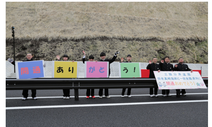
パレードの見送り

開通式に併せて、宮古市及び岩泉町主催による『開通記念ウォーキング』イベントが開催されました。約200名の方々が参加し、田老北ICから田老真崎海岸ICまで歩きました。