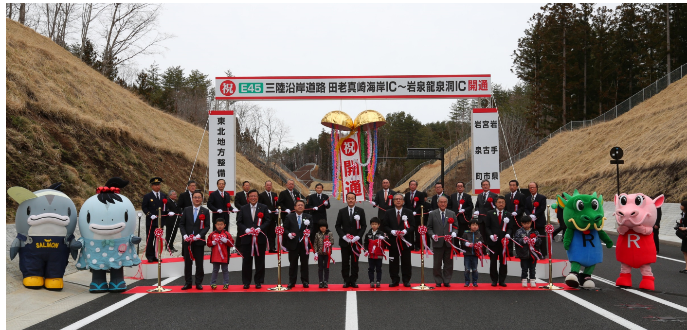
テープカット&くす玉開き

開通に先立ち、開通式を田老真崎海岸IC付近の本線上で盛大に開催しました。開通式後にはパレードを行い、道路の利便性を実感していただきました。