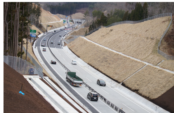
田老真崎海岸IC付近