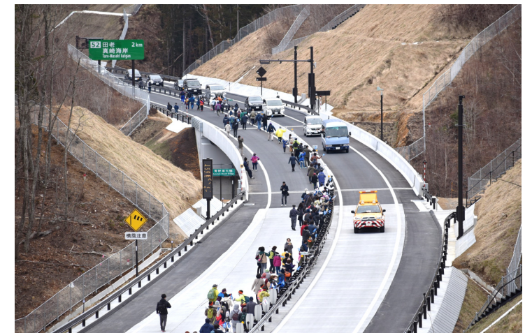
パレードとのすれ違いの様子