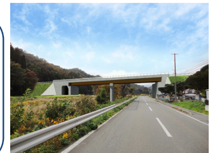
神田川橋(仮称)完成予想図

これから茨城県取手市の工場 で橋桁の製作を行い、塗装した橋 桁を輸送し架設をします。 早期完成を目指し、工事完了 まで安全第一で進めてまいります のでよろしくお願いいたします。