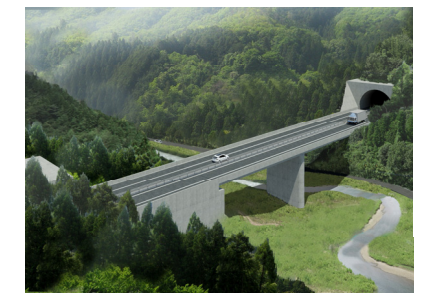
田の沢川橋(仮称)完成予想図

2月頃よりプレストレストコン クリート製の橋梁工事に着手す る予定です。工事期間中は生コン 車など、大型車両の出入りがあり ます。 地域の皆様にはご迷惑をお掛け しますが、細心の注意を払い、 安全を第一に工事を進めてまい りますので、ご理解、ご協力の 程よろしくお願いいたします。