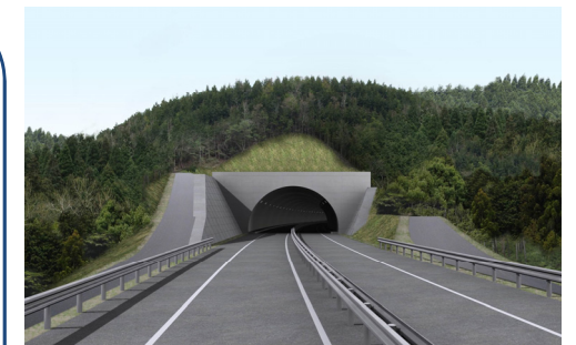
千徳トンネル(仮称)完成予想図

来年1月から工事を開始する予定です。 宮古田老道路の区間では最後のトンネル 工事であり、早期完成を目指して頑張っ ていきたいと思っております。 近隣住民の皆様には、ご迷惑をお掛け しますが、安全最優先、環境対策に十分 配慮し工事を行いますので、ご理解ご 協力よろしくお願いいたします。