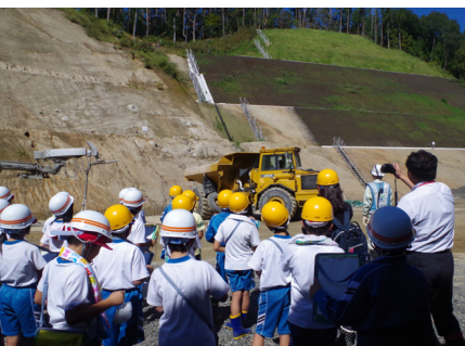
重ダンプのデモンストレーション!