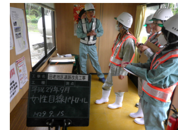
現場休憩所を点検