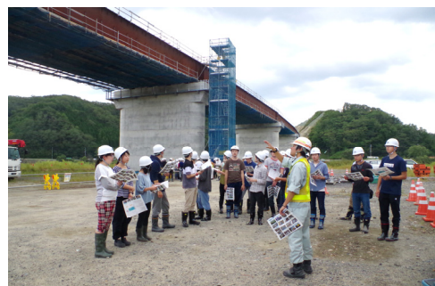
橋りょう工事の完成までの流れを学びました

岩手大学理工学部3年生80名の皆さまが、上部工の施工が進んでいる(仮称)閉伊川橋(延長502m)を見学し、国の進める復興事業や橋りょう工事について理解を深めました。