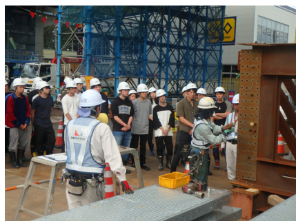
ボルトつなぎの実演を見学 橋の構造を学びました