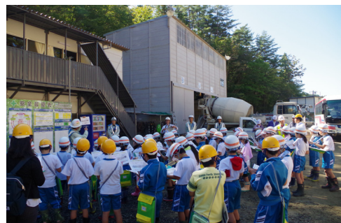
トンネルや橋の作り方を学びました

質問コーナーでは、「トンネル1kmつくるのに何日くらいかかりますか?」「機械は何台ですか?」など質問が尽きませんでした。