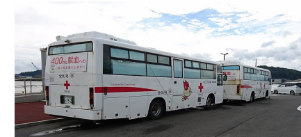
この献血バスを見かけたらぜひご協力をお願いします!

宮古田老安全協議会のメンバー47名は、「シートピアなど」にて献血活動に協力させていただきましたことを報告します。