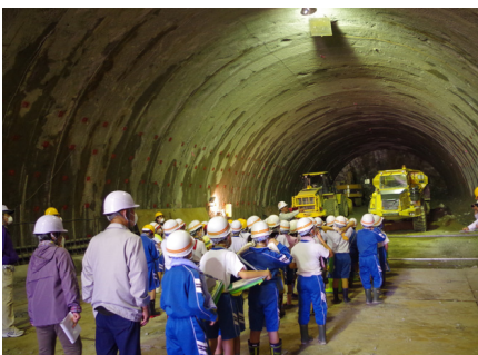
掘削が進むトンネルの坑内を見学しました