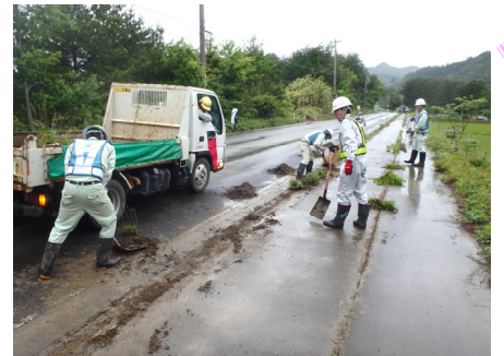
道路脇の土砂や雑草を取り除きました