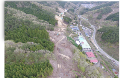
現場空撮(着工前) 当現場では、ドローンでの空撮により工事の進捗状況を撮影しております。