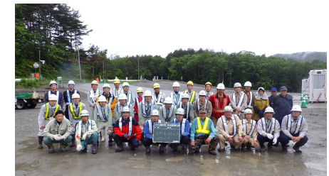
青野滝地区の皆さんと集合写真

ご意見・ご感想をお寄せ下さい。 また、工事見学のご希望がありましたら、下記に記載のURLから工事見学の募集を承っております。 URL: http://www.thr.mlit.go.jp/sanriku/index.html ・国土交通省 東北地方整備局 三陸国道事務所 〒027-0029宮古市藤の川4番1号 建設監督官(宮古田老道路担当) TEL:0193-71-1745 FAX:0193-71-1738 ・三陸沿岸道路事業促進チーム(宮古田老工区) 三陸国道事務所東庁舎1-2 ホームページ 工事現場を「く」施工監理担当 TEL:0193-77-4731 このバナーから募集しています。 ※宮古中央IC以外のICや構造物の名称は仮称です※