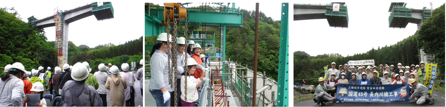
橋の下から施工を見学 橋の上から施工を見学 橋をバックに記念撮影

長内川橋工事は、下荒谷2地区自治会33名お招きし、現場見学会を開催しました。見学会では、上部工工事が進んでいる高さ約50mの橋の上にもものぼり、工事の進捗を実感していただきました。見学者からは橋の高さや、昇降設備のエレベータに驚いていました。