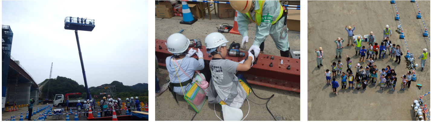
高さ約10mの景色を体験！おもしろかったと好評でした ボルトの締付を体験！このボルトが橋を支えています 高さ18mからの集合写真

閉伊川橋上部工工事は、宮古市立津軽石小学校4年生28名をお招きし、現場体験学習会を開催しました。現場体験学習会では、橋の作り方を学び、高所作業車やボルトの締付などを体験しました。