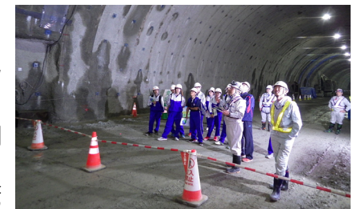
田老第2トンネル坑内にて掘削の様子を見学しました