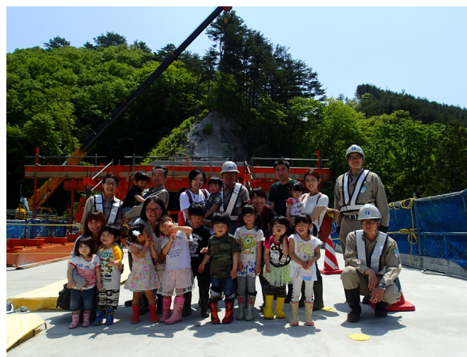
橋の上で記念撮影！