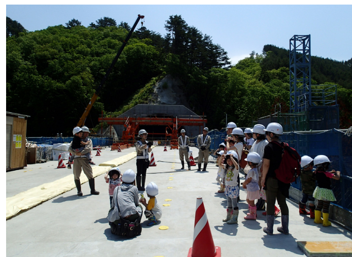
橋の上で見学しました