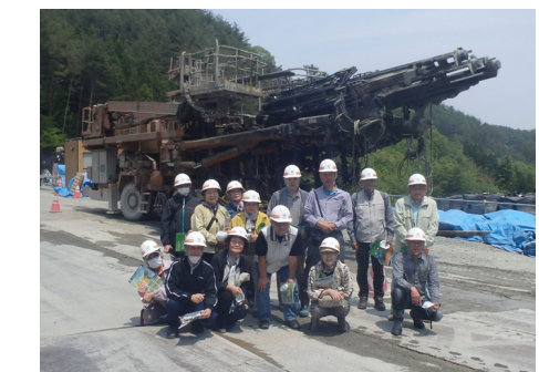
崎山第1トンネルで使用する機械と記念撮影！