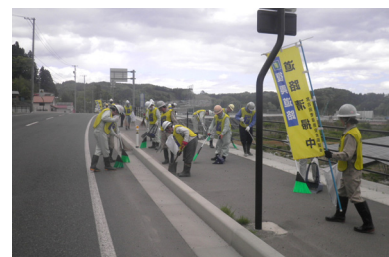
← 清掃状況 →