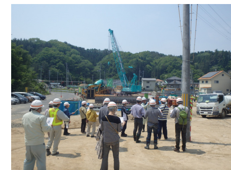
杭施工中の近内川橋杭長は16.5m!