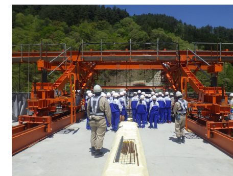
田代川橋にて橋上から上部工工事を見学しました