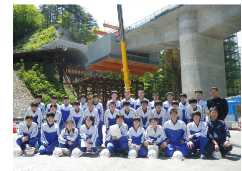
田代川橋前で記念撮影！