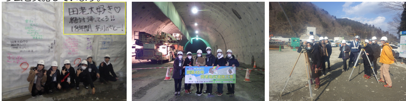
田老第1トンネル防水シートにメッセージを頂きました！ 田老第2トンネル坑内にて記念撮影！ 測量体験 高さや距離を計測しました！

※「みやっこベース」では、地元の自然や産業を体験し地域の魅力を発見・再認識することで地元への定住を志す人材の増加を図ることを目的として「地元修学旅行」という体験型学習プログラムを実施しています。