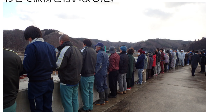
手つなぎ・黙祷の様子

田老防潮堤にて行われた、市民団体主催の手つなぎプロジェクトへ協議会メンバーも参加させていただきました。各現場でも発生時刻にあわせて黙祷を行いました。