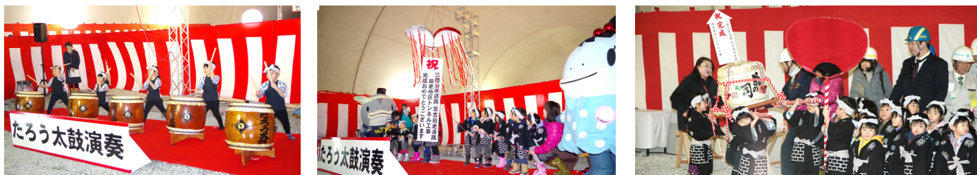
児童館の皆さんの大活躍により、盛大な完成式となりました！ 写真左から「たろう太鼓演奏」「くす玉開き」「子供みこし」

田老第3トンネル(延長553m)及び田老第4トンネル(360m)の完成式に、地元代表者の方々や田老児童館の皆さんをお招きし、工事の完成を一緒にお祝いいただきました。