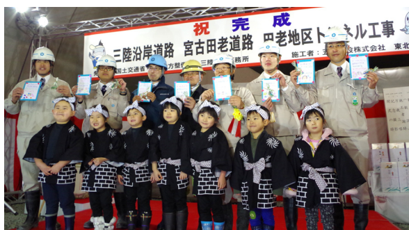
頂いたメッセージカードを手にする工事担当者 と児童館の皆さん

田老児童館の児童の皆さんの応援により、ほのぼのとした温かみのある完成式を行うことができました。くす玉が早く割れはしないかとドキドキでしたが、児童の皆さんがうまく合わせてくれました。関係者の皆様のご理解とご協力を頂き、工事は無事完成しました。約3年間お世話になりました。ありがとうございました。 施工者：五洋建設(株) 高橋 哲哉