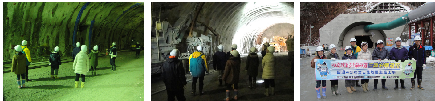
崎山第2トンネル内を歩きながら見学しました！