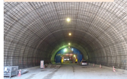
施工：⑧三井住友・日本国土JV

椋内第2トンネル坑内の状況です。覆工(ふっこう)コンクリートの打設をしています。