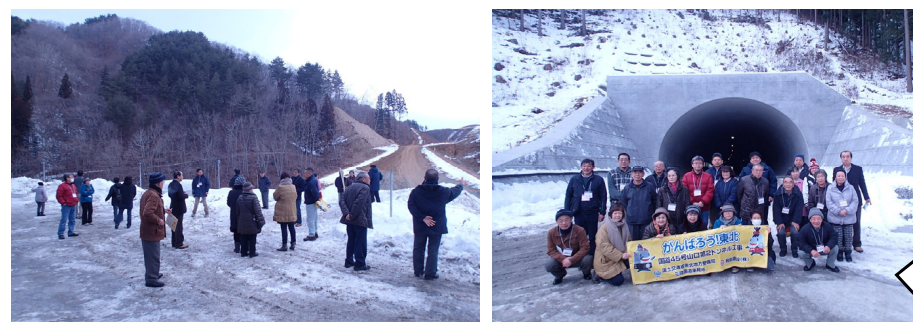
トンネルを通り向け、トンネルの前で記念撮影しました！

山口1・2丁目自治会 1月29日(日) ～山口第2トンネル工事 飛島建設(株)～