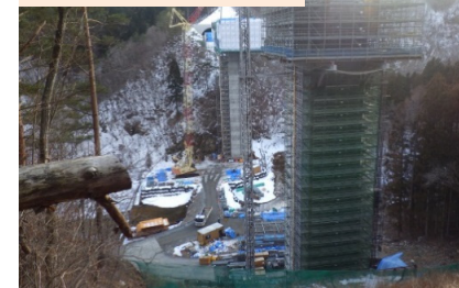
施工：⑩ピーエス三菱

椋内第2トンネル坑内の状況です。覆工(ふっこう)コンクリートの打設をしています。