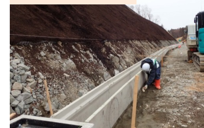
施工：⑮世紀東急工業