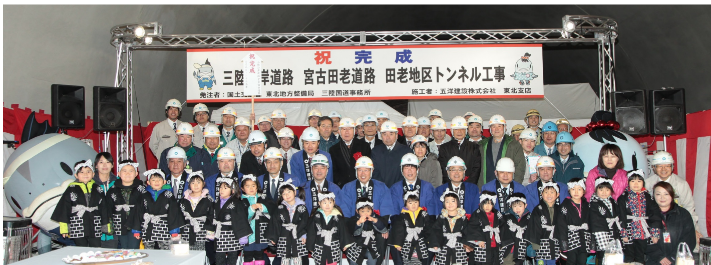
出席した皆さんとサーモンくん&みやこちゃんと一緒に記念撮影！