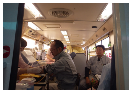
活動の様子② 車内で問診と血液濃度確認後 献血を行いました