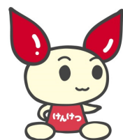
献血キャラクター けんけつちゃん

宮古田老道路安全協議会のご協力で開催する献血も4回目となりました。今回は過去最多の48名の方にご参加いただきました。業務の兼ね合いもある中、声掛けしていただいた会長はじめご参加いただきました皆様、本当にありがとうございました。