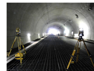
←←← トータルステーション（TS） 位置情報を施工器械に無線で 送信