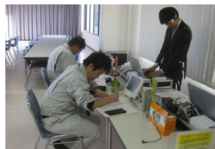
活動の様子① 問診票へ記入