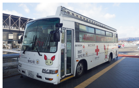
この献血バスを見かけたらぜひご協力をお願いします！

宮古田老安全協議会は“シートピアなあと”にて、献血活動に協力させていただきました。例年、冬期は血液が少なくなる傾向にあることから、この時期での協力となりました。