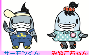
サーモンくん みやこちゃん