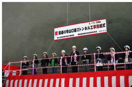
市長・児童による 貫通点通り初め