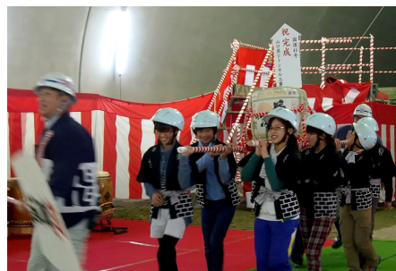
児童による樽神輿 元気な声で登場しました