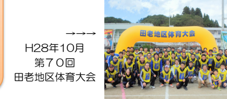
H28年10月 第70回 田老地区体育大会