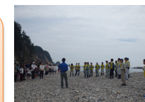
H28年7月中の浜清掃活動(浄土ヶ浜 ビジターセンター)

新年 明けましておめでとうございます。宮古田老道路安全協議会を代表しまして、新年のご挨拶を申し上げます。 日頃は、復興道路の工事にご理解とご協力を頂きありがとうございます。 本年も復興道路の早期完成に向け、会員会社一同、精一杯がんばってまいりますので、引き続きご理解とご協力の程よろしくお祈りいたします。